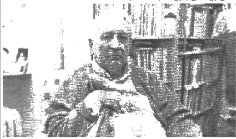
பட்டது மனித மனத்தில் அழிந்தவை குறித்து இவர் அளித்துள்ள இலக்கியப் பரிசை வென்றார். இந்த விருது அவருக்கு வழங்கப்பட்டது.

கவிதை மட்டுமல்லாமல் மனோதத்துவ அறிவியல், கவிஞருமான போமர் டிரான்ஸ்ட்ரூமர் 2011ஆம் ஆண்டுக்கான இலக்கியப் பரிசை வென்றார்.