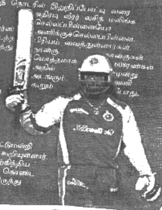
விளையாட்டு வீரர் கெய்ல்

மிகநினைவாக தங்கள் மனப்போக்கை நாட்டி சேர்ந்தவர் கிரிக்கெட்டில் ஐந்தாவது ஐபிஎல் இருபதுக்கு இருபது கிரிக்கெட் சுற்றுப்போட்டிகள் எனும் போது முக்கியமாக கலாத்ததை சர்க்கும் சில வீரர்களில் முதன்மை பெறுபவர் கிரிக்கெட்டில் இவர் மோயல் செலக்ஞர்ஸ் போடிகள் அணிக்காக விளையாடுகிறார். கடந்த வருடம் இவர் இந்த அணியில் இவையிலேயே சேர்ந்து கொண்டார். இதுவே அவரது முதல் மோயல் செலக்ஞர்ஸ்களால் அவரது ஆர்முக்களாகவும் அவரது அபாயப் பற்றிக் கூறும் கடந்த வருடம் தனி மனிதனாக அணியை இருபது போட்டிகளுக்கு கொண்டு சென்றவர் என்று கூறுகிறார்கள். இறுதிய போட்டியில் செவ்வை கண்டாஹம் ரிகவம் கடுமையான போட்டித் தொழில் செய்து கொண்டு வந்த கெய்ல் ரிகசு சிந்தித்து வந்தவராக இவர் மோயல் செலக்ஞர்ஸ் அது போலான இவர் மோயல் செலக்ஞர்ஸ் பெயர்களை ரசிகர்கள் இவர் மீது அளவுகடந்த 2011 ஆம் ஆண்டு அடித்த ஆளுகை நாடுபுது ஐயப்பதாரா குவித்திருந்தார் கெய்ல் அவரது கருவிகளும், இரண்டு சதங்களும் மீண்டும் பயிற்றுநர் மோயல் செலக்ஞர்ஸ் கெய்ல் போலான வீரர் அணியின் இருபது மிகவும் தாழியமானது ஆட்டத்தை தன் இவ்வப்பாடுகொண்டு செல்வதில் இவர் சமர்த்தர் என்று கூறியுள்ளார். இன்னொரு விவரகக் கருத்துக்கூறும் போது மோயல் செலக்ஞர்ஸ் அணியில் கெய்ல் விளையாடுவது இந்த அணிக்கு யட்டுவாண்டு மேமீநிதிபத் தீவகளுக்கே பெருமை என்று கூறியுள்ளார். இவர் இப்படிக்க கூறக் காரணம் கெய்ல் பெய்கித்திய கிரிக்கெட் அணியில் இவரும், பயிற்றுநர் கெய்ல் இரண்டு மூரண்பாடு வாரணமக தேசிய அணியில் இருந்து ஓரங்கட்டப்பட்டுள்ளதன் ஆதங்கமாக இருக்க வேண்டும். இப்போது ஐபிஎல் ஆட்டங்கள் நடைபெற்றுக் கொண்டிருக்கின்றன இந்த ஐந்தாவது ஆட்டத் தொடரிலும் கெய்ல் அணியிலேயே தக்க பதில்களை ஏற்படுத்தியவர் என்று நிச்சயம் நம்பலாம்.