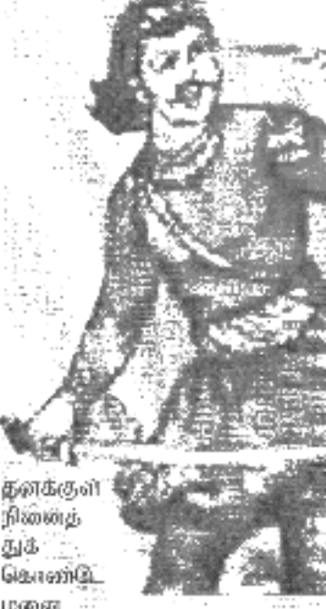
தனக்குள் நினைத்துக் கொண்டிருக்கிற மனைவி யிடமிருந்து தேரிக் கோப்பையை வாங்கிக் கொண்டார்.

இவ்வளவின் அடியும்; நுனிபும் இல்லாத கதை கதைக்கிறான்... என