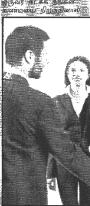
அவர் நன்றி சொல்லாத கையிலே ஒரு பொருள் வாங்கும் பொது கூட கண்டகாரருக்கு நன்றி சொல்லுவார்கள்.

நன்றி சொல்லும் வழக்கம் அவர்களிடம் ஒரு கலாசாரமாகவே மாறி விட்டது. நன்றிவாரை எங்கேயும் வைக்காமலும் கற்றுக் கொள்ளாமல் தப்பிவிட்டால்.