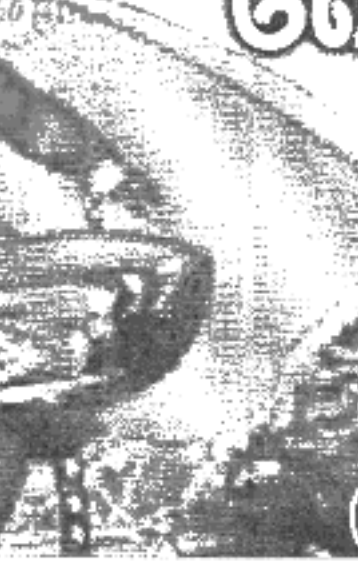
பார்த்து பெயர்மையாக புள் முறுவலொன்றை உதிர்த்தார்.

அதுமே... என்று வியப்புத் தொவிக்கக் கூறியவர். அவளைப்