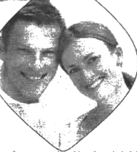
திருமணமாகாதவர் வாழ்க்கைக்கு முற்றுப்புள்ளி வைத்து திருமணம் செய்துக்கொள்ள முடிவெடுத்தால் என்ன?

ரீதியான உறவு ஏற்பட வாய்ப்பில்லை திருமணத்தின் மூலம் மட்டுமே உடரீதியான அங்கீகாரம் கிடைக்கும். விவிக் கு கெதர் வாழ்க்கையில் இதை எதிர்பார்க்க முடியாது. திருமணம் என்பது தனிமையை விரட்டும் அசுமறந்து மனைவியை திருமணம் செய்து கொள்ளுங்கள் என்கின்றனர் உலகியல் நிபுணர்கள். வேலை வாய்ப்பற்றவர்களை இறந்தாலும், திருமணம் முடிந்தவர்களை இறந்தால் அது உங்களுக்கு எளிதான, ஆலோசனையான கார்ப்பிடு திசுக்கிறது அதேபோல் திருமணத்திற்கு பின்னர் திருமணம் வேலைக்கு செல்லவர்களை இறந்தால் இதுவரும் சேர்ந்து திறமைப் பணம் சம்பாதிக்கவும், சேமிக்கவும் முடியும் என்பதும் நிபுணர்களின் ஆலோசனையாகும். என்ன