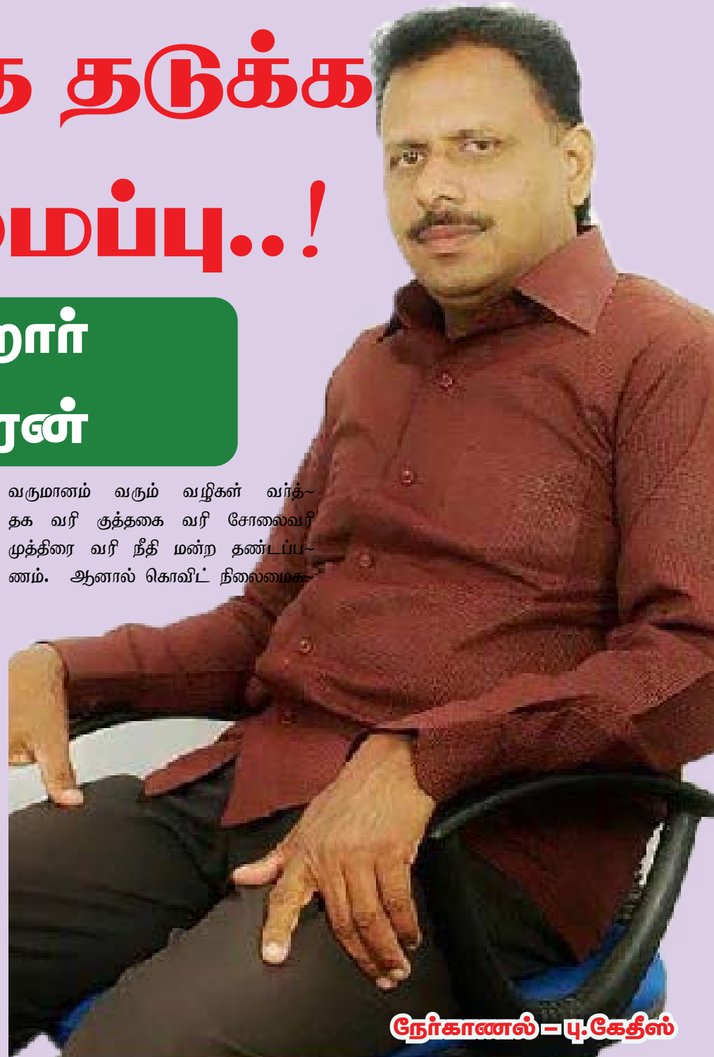
நேர்காணல் - டி.கே.சி

வருமானம் வரும் வழிகள் வர்த்தக வரி குத்தகை வரி சோலைவரி முத்திரை வரி நீதி மன்ற தண்டப்பணம். ஆனால் கொவிட் நிலைமை