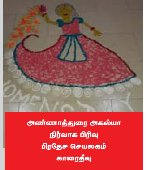
அண்ணாத்துரை அகல்யா நிர்வாக பிரிவு பிரதேச செயலகம் காரைதீவு