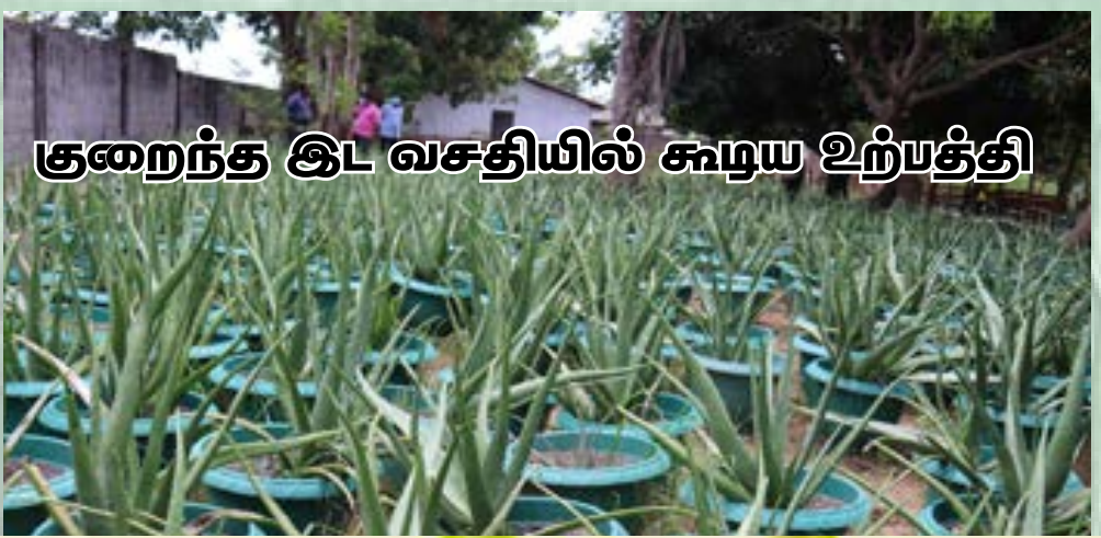
குறைந்த இட வசதியில் கூடிய உற்பத்தி