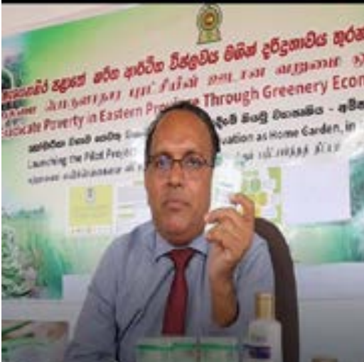
ஆசாத் எம் அலியார் திட்ட பணிப்பாளர்

கற்றாழை பயிர்ச் செய்கையை வீட்டுத்தோட்டமாக்குதல்