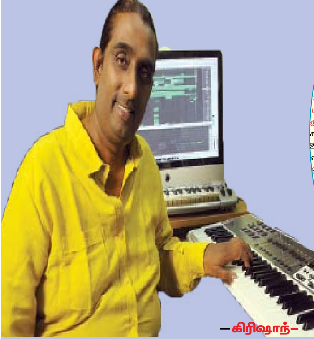
— கிரிஷாந் —

பிரபல தென்னிந்திய இசையமைப்பாளர் தினா "கல்முனை நெற்றுக்கு" தெரிவிப்பு