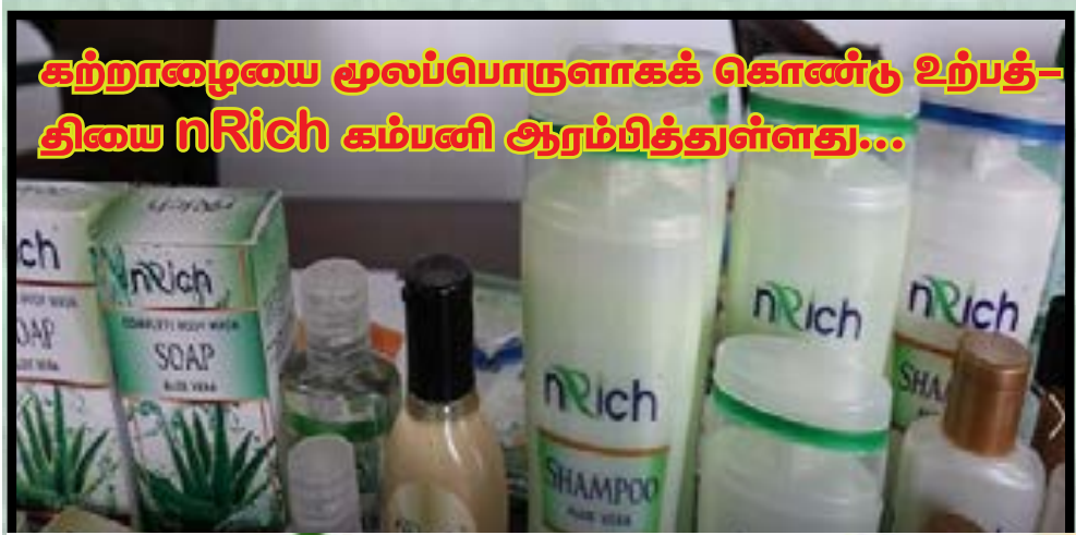
கற்றாழையை மூலப்பொருளாகக் கொண்டு உற்பத்தியை nRich கம்பனி ஆரம்பித்துள்ளது...