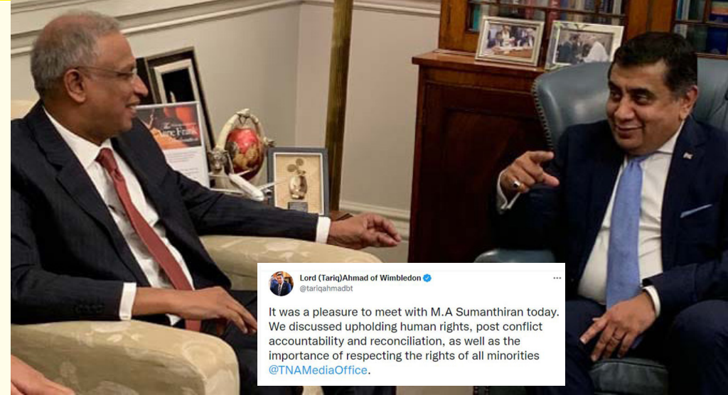
Lord (Tariq) Ahmad of Wimbledon @tariqahmadot It was a pleasure to meet with M.A Sumanthiran today. We discussed upholding human rights, post conflict accountability and reconciliation, as well as the importance of respecting the rights of all minorities @TNAMediaOffice.

நமது அரசியல் நிருபர் அமெரிக்கா கனடா ஆகிய நாடுகளுக்கான விஜயத்தை முடித்துக் கொண்டு பிரிட்டன் சென்ற பாராளுமன்ற உறுப்பினர் சுமந்திரன் பிரிட்டிஷ் அமைச்சரை சந்தித்து பேச்சுவாரித்தை நடத்தி இருக்கிறார். பிரிட்டன் மற்றும் தெற்காசிய, ஐக்கிய நாடுகள் மற்றும் பொதுநலவாய விவகாரங்களுக்குப் பொறுப்பான வெளிவிவகார அமைச்சர் தாரிக் அஹமட் பிரபுவை சந்தித்த அவர், சுமார் ஒரு மணி நேரம், இலங்கை விவகாரம் மற்றும் அரசியல் நிலை தொடர்பாக பேச்சுவாரித்தை நடத்தியிருக்கிறார். இதன்போது, வொஷிங்டனில் நடந்த பல சுற்றுப் பேச்சுவாரித்தைகளின் விவரங்களையும் அவர், விலாவாரியாக எடுத்துக் கூறியதாக அங்கிருந்து கிடைக்கும் தகவல்கள் தெரிவிக்கின்றன. இந்த சந்திப்பு நேற்று முன்தினம் (25) நடந்ததாக உத்தியோகபூர்வமாக அறிவிக்கப்பட்டுள்ளது. இந்த சந்திப்பு தொடர்பில், அமைச்சர் தாரிக் அஹமட் பிரபு,