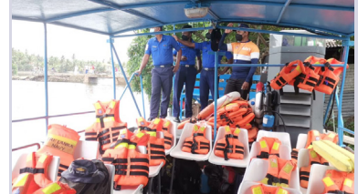
திருகோணமலை - குறிஞ்சாக்கேணி பாலத்திற்கு அருகில் படகு சேவை நடத்தப்படுவதாக கடற்படை தெரிவித்துள்ளது.

ஒரே நேரத்தில் 25 பேர் வரை பயணிக்கக் கூடிய வகையில் இந்தப்படகு சேவை முன்னெடுக்கப்படுவதாக கடற்படை அறிவித்துள்ளது. படகில் ஏறுதல், இறங்குதல் நடவடிக்கைக்காக பாதுகாப்பான தற்காலிக இறங்குதறையொன்றையும் கடற்படையினர் அமைத்துள்ளனர். நேற்று முன்தினம்