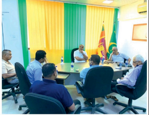
ஒதுக்கலுக்கெதிராகக் குறி கொடுத்த ஜனாதிபதி நெல்சன் மன்டேலாவின் முயற்சியின் பயனாக ஏற்படுத்தப்பட்ட 'மக்கள் யாப்பு' அநேக நாடுகளுக்கு சிறந்த முன்மாதிரியாக வரலாற்றில் இடம்பெற்றுள்ளதாகவும் இதன்போது சுட்டிக்காட்டப்பட்டது.