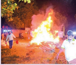
அவருடைய மருமகனான செல்வி வருமறு.

சோழன் சாதனை புத்தகத்தில் பெயர் பதித்த முசாதித் விசேட செவ்வி