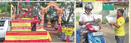
துண்டு பிரச்சாரம் வழங்கப்பட்டிருந்ததால், வவுனியா நகர் வழியாக மாண்புமிகு தேர்தல் அலுவலகம் சென்றது. இது போது தமிழ்த் தேசிய மக்கள் முன்னணியின் உறுப்பினர்கள், ஆதரவாளர்கள், வவுனியா மின் தொடர் பேரூராட்சித்திற்கும் சரட்டுமேயும் காணாமல்போனவர்களின் உறவினர்கள் கலந்துகொண்டிருந்தனர்.

தமிழ்த் தேசிய மக்கள் முன்னணியால் 13ஆவது திருத்தச் சட்டத்திற்கு எதிரான நடவடிக்கைகளை 30ஆம் திகதி யாழ்ப்பாணத்தில் நடத்தப்பட்டவுடன் பேரூராட்சித்திற்கு விழிப்புணர்வு ஏற்படுத்தும் வகை மாண்புமிகு தேர்தல் அலுவலகத்திலிருந்து முல்லைத்தீவு நோக்கிப் புறப்பட்டது. காலை 10 மணிக்கு வவுனியா நகரசபையின் முன்பகல் வவுனியா நகர சபைக்குழு இடையில் காணாமல்போனவர்களின் உறவினர்களால் கற்றுப் ஏற்றப்பட்டோர் நினைவு ஆரம்பித்து வைக்கப்பட்டது. குறித்த மாண்புமிகு தேசிய மக்கள்