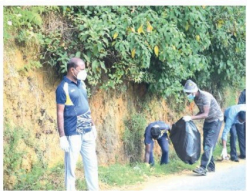
நுவரெலியா பிரதேச சபையின் அனைத்து பதவிகளிலும் மேற்கொள்ள நடவடிக்கைகள் எடுக்கப்பட்டுள்ளன.

(செ.திவாகரன்) நுவரெலியா பிரதேச சபையின் தனிசாரி வேறு போதாளிகள் வேண்டுமோக்கிண்பு, கனடி சபையின் அதிகாரத்திற்குட்பட்ட தரப்புகள், எல்சேடல், பிலக்யூ, ருளன், எலிய, மீயிமிமான ஆகிய பிரதேசங்களில் நுவரெலியா பிரதேச சபையின் அனைத்து உத்தியோகத்தர்கள் மற்றும் ஊழியர்கள் சிரமதளம் பணிகளில் ஈடுபட்டனர்.