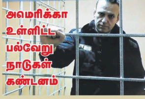
அமெரிக்கா உள்ளிட்ட பல்வேறு நாடுகள் கண்டனம்

ரஷ்யாவில் சிறைப்படுத்தப்பட்டுள்ள எதிர்க்கட்சித் தலைவர் அலெக்சி நவால்னியை பயங்கரவாதியாக அந்நாட்டு அரசாங்கம் அறிவித்துள்ளது. இந்த அறிவிப்பை, உலக நாடுகளை அதிர்ச்சிப்படையச் செய்துள்ளது. அமெரிக்கா உள்ளிட்ட பல்வேறு நாடுகள் இத்தக கண்டனத்தை வெளியிட்டுள்ளன. ரஷ்யாவில் ஜனாதிபதி பட்டினையம் அவரது அரசையும் கடுமையாக விமர்சித்து வந்தவர் அந்த நாட்டின் எதிர்க்கட்சித் தலைவர் அலெக்சி நவால்னியே. இவரை கொலை செய்யும் நோக்கில் கடந்த 2020-ஆம் ஆண்டு விமான நிலையத்தில் அவர் குடித்த மயிற்சோகை என்று இராசபாளன் குச்சை கவந்து கொடுத்ததில் அவர் கிட்டத்தட்ட இறக்கும் நிலைக்கு சென்றார். இந்த சதியின் பின்னணியில் ஜனாதிபதி பட்டினியின் அரசு இருப்பதாக குற்றச்சாட்டு எழுந்தது. அதனைத் தொடர்ந்து இந்த விவகாரத்தை அமெரிக்கா மற்றும் ஐரோப்பிய நாடுகள் ரஷ்யாவுக்கு திரிசூலு ஒன்று திரிந்தன. இதற்கிடையில் நவால்னியைக் கைது செய்து கொடுக்கப்பட்ட பின்னணியில் ரஷ்ய அரசாங்கம் இருப்பதாக அமெரிக்க உளவுப் பிரிவு ஆய்வு செய்து முடிவுக்கு வந்தது. அதன் பிறகு மூத்த ரஷ்ய அரசு அதிகாரிகளுக்கு எதிராக அமெரிக்கா பொருளாதாரத் தடைகளை விதித்தது. இதனிடையே இராசபாளன் தாக்குதல்களுக்கு ஆளான நவால்னியே