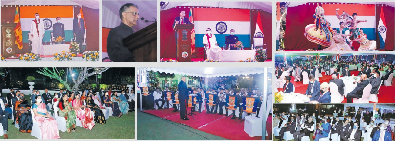
இந்தியாவின் 73 ஆவது குடியரசு தினத்தை முன்னிட்டு உயர்நீதிமன்றம் கொழும்பில் இந்நிதியில் விசேட வரவேற்று உபசாரம் நேற்றுமுன்தினம் (26) ஏற்பாடு செய்யப்பட்டிருந்தது. இந்த நிகழ்வில் நிதி அமைச்சர் செல்வ குமாரதுங்க, வெளிநாட்டினுடைய அமைச்சர் ஜே.எல்.பிரிஸ் நெளவ விருந்தினராகவும் கலந்துகொண்டார். மேலும், அமைச்சர்கள், நாடாளுமன்ற உறுப்பினர்கள், சிசேட்ட அதிபரிகள், இராஜதந்திரிகள், ஊடக நிறுவனங்களைச் சார்ந்தோர் எனப் பலரும் பங்கேற்றிருந்தனர்.

இம்முறை நாடளாவிய ரீதியில் 3 இலட்சத்து 45 ஆயிரத்து 242 பரீட்சார்த்திகள் உயர்தரப் பரீட்சை எழுதவுள்ளனர். அத்துடன், 2 ஆயிரத்து 438 பரீட்சை மத்திய நிலையங்களில் பரீட்சைகள் அமைக்கப்பட்டவுள்ளன குறிப்பிடத்தக்கது.