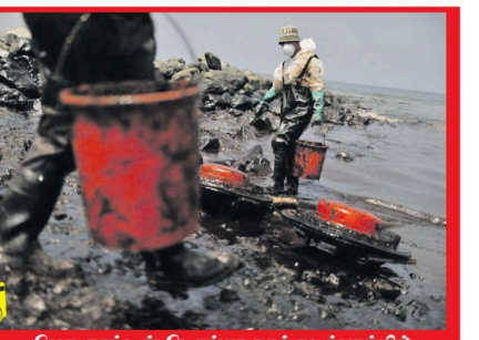
பெரு நாட்டின் பொங்கா நகர் சுற்றுப்பரப்பில் ஏற்பட்ட பாரிய எண்ணெய்க் கசிவை சுத்தப்பெய்யும் ஊழியர்கள்.