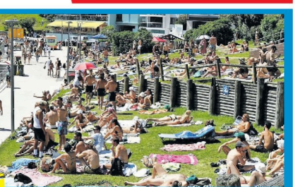
அவுஸ்திரேலிய தேசிய தீவமான நேற்றுநர் தினம் நாடு முழுவதிலும் கொண்டாட்டங்கள் இடம் பெற்றன. சி.வி.க. தற்காலிகப் பெருந்திரிபான மக்கள் கையிருந்தனர். அவியாட்டங்களிலும் கூடுபட்டனர்.