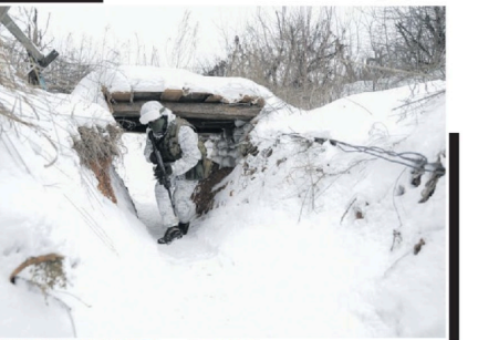
ரஷ்ய படைகள் உக்ரைனில் ஊடுருவியதன் நிலையில் சுற்று பரிப்பொழிவுக்கு மத்தியில் பாதுகாப்புக் கூடாமலில் கூடுபட்டிருக்கும் இராணுவ வீரர்.