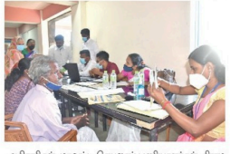
அதிமேல், மாவட்ட செயலகப் பணியாளர்கள், சிறு அலுவலர்கள் எனப் பலரும் கலந்துகொண்டிருந்தனர்.