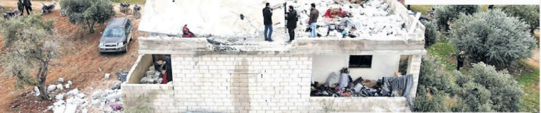
1 USMC Helicopters arrive in the village of Alnakh, a town close to the Turkish-Syrian border. They are looking for an Arabic to tell everyone in village to surrender.

இதுகுறித்து அமெரிக்க ஜனாதிபதி ஜோைடன், தீவிரவாத அமைப்பின் தலைவர் அபு இப்ராஹிம் அம்-ஹகிமியை குறிவைத்து சிரியாவின் வடமேற்கே அமைந்துள்ள இத்தியி மாணத்தியில் அமெரிக்க சிறப்புப் படையினர் புதன்கிழமை நள்ளிரவில் அதிரடித் தாக்குதல் நடத்தினர். இந்த நடவடிக்கையில் அவர் உயிரிழந்தார் என்று அறிவித்தனர்.