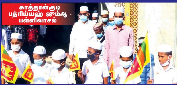
காத்தான்குடி பத்ரியயஹ ஜாமிஆ பள்ளிவாசல்