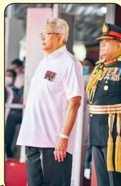
தெளிவானவையாக இருப்பினும், அவற்றைச் செயற்படுத்தும் போது இதைவிடச் செயற்பாட்டு ரீதியான பாய்ஸ்களின் ஒவ்வொரு துறையிலும் இருக்கும் வேண்டும்.

இவ்வகையிலும், 2,500 ஆண்டுக்கு மேற்பட்ட வரலாற்றின் காலப்பகுதிகளில், வெளிநாட்டு ஆக்கிரமிப்பாளர்களுக்கு எதிராக போராடியது உட்கைரணம், வகைப்பாடு, மதராசாக்கிரமப்பாடு, விஜயபாடு ஆகியவை போராக்கிரமப்பாடு போன்ற சிறந்த மன்னர்கள்