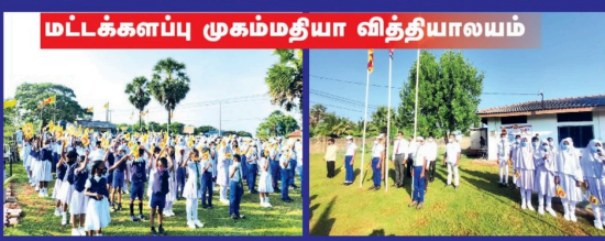
மட்டக்களப்பு முகம்மதியா வித்தியாலயம்