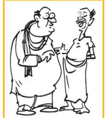
அப்ப எல்லோரும் தியாகிகள் தான் இனி...