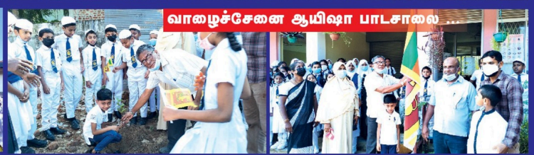
வாழைச்சேனை ஆயிஷா பாடசாலை