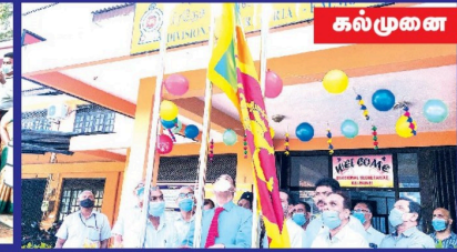
கல்முனை பிரதேச சபை...