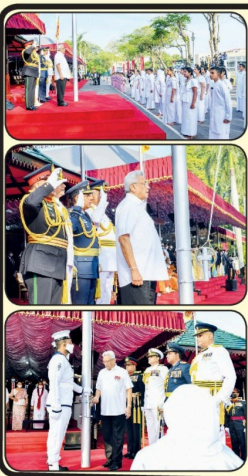
கத்திரிமான ஒரு நாட்டின் கௌரவமிக்க ஒரு பிரஜையாக வாழ்வதற்குள் உரிமை முன்விட்டு, வரலாறு முழுவதும் பாட்டுகளின் மக்கள் கவரங்களை நடத்தியுள்ளார்கள். போர்களை முன்னெடுத்துள்ளார்கள். பெரும் அர்ப்பணிப்புகளைச் செய்துள்ளார்கள்.

இவ்வகையிலும், 2,500 ஆண்டுக்கு மேற்பட்ட வரலாற்றின் காலப்பகுதிகளில், வெளிநாட்டு ஆக்கிரமிப்பாளர்களுக்கு எதிராக போராடியது உட்கைரணம், வகைப்பாடு, மதராசாக்கிரமப்பாடு, விஜயபாடு ஆகியவை போராக்கிரமப்பாடு போன்ற சிறந்த மன்னர்கள்