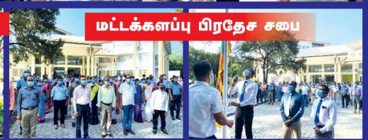
மட்டக்களப்பு பிரதேச சபை