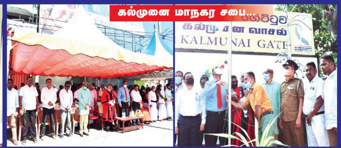
கல்முனை மாநகர சபை...கலிஹை