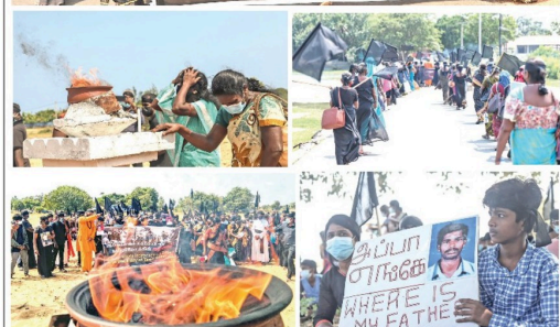
74ஆவது சுதந்திர தினமான வடக்கு, கிழக்கு வலிந்து காணாமலாக்கப்பட்டவர்களின் உறவினர்கள் மற்றும் வடக்கு, கிழக்கு சிலில் சமூக அமைப்புகள், பாதிக்கப்பட்ட தரப்பினர் என அனைத்தும் பாரிய கவனம்ஈடுபட்டு பேராயர் மெல்கம் ரஞ்சித் ஆண்டகை தேர்தலை (04) முன்னெடுத்திருந்தனர். இதன்போது எடுக்கப்பட்ட படங்கள்.