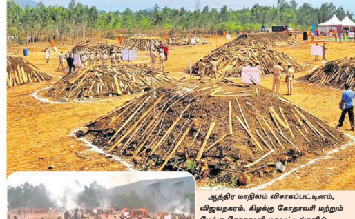
ஆந்திராவில் 2 இலட்சம் கிலோ கஞ்சா தீயிட்டு எரிப்பு