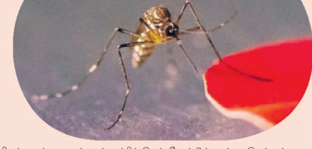
சிவப்பு அல்லது ஆரஞ்சு வண்ணத்தில் இருக்கவேண்டும். அப்படி இருந்தால், நுளம்புகளுக்கு சாப்பாட்டு மணி அளவுக்கு வரக்கூடிய பொருள். மற்ற பூச்சிகளுக்கு இதேபோல் நிறப் பாருபுடும் பற்றிய அறிவு உண்டா என விஞ்ஞானிகள் ஆராய்ந்து வருகின்றனர்.

மனித வாடையை முகர்ந்துவிட்டால், நுளம்புகள் அருகே வந்து கடிக்கத் தோதான இடம் பார்க்கும். இது அறிவியல்பூர்வமான உண்மை. மனித மூச்சிலுள்ள கார்பன்-டை-ஆக்சைட் வாடாதான் நுளம்புகளுக்கு அழைப்பிதழ். ஆனால், தற்போது வெளிப்புற பக்கைகளுக்கு விஞ்ஞானிகள் கூடுதல் தகவலையும் கண்டறிந்துள்ளனர். அதாவது, மனித மூச்சிலுள்ள கார்பன்-டை-ஆக்சைட் வாடையை கண்டு கொண்டு நிறு, அவை சுற்றிலும் நேரடும் பார்க்கின்றன. அப்போது சிவப்பு அல்லது ஆரஞ்சு நிறத்தில் ஏதாவது துட்ப்படுகிறதா என்பதை தேடுகின்றன. அப்படி துட்ப்பட்டதும், அதை நேருகி தங்கள் இரத்தப் பசியை தீர்க்க முயல்கின்றன. ஆய்வகங்களில் மயந்திரங்களில் பொருட்களை வைத்தபோதும், நுளம்புகள் இந்த இரத்த முள்ளைப் பொருட்களையே நறடுவதை ஆய்வாளர்கள் கவனித்தனர். இது ஏன் என்று ஆராய்ந்தபோது, மனிதர்கள் எந்த நிறத் தோலை உடையவர்களாக இருந்தாலும், அவர்களது தோலிலிருந்து சிவப்பு அல்லது ஆரஞ்சு நிற ஒளி அவைகள் பிரதிபலிக்கின்றன. முதலில் கார்பன்-டை-ஆக்சைட் வாடை அந்த இடத்தில் இருந்து வரவேண்டும். அடுத்து அந்த இடம்