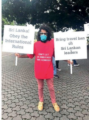
அவுஸ்திரேலியாவில் இலங்கை கிரிக்கெட் அணி விளையாடும் தைலாந்தில் முன்பக தமிழர்கள் போராட்டம் நடத்தியுள்ளனர்.