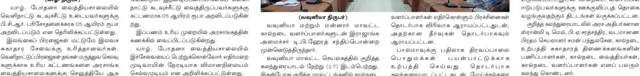
(வுலனியூர் திருபு) வவுனியா மற்றும் மன்னார் மாவட்ட கால்நடை வளர்ப்பாளர்களுடன் இராஜாங்க அமைச்சர் டி.பி. ஜோரஜ் சந்திப்பாளர் ஜோரஜ் சந்திப்பு நடைபெற்றது. வவுனியா மாவட்ட செயலகத்தில் குறித்த சந்திப்பு நேற்று (17) இடம்பெற்றது. இன்னொரு குறித்த மாவட்டங்களில் கால்நடை வளர்ப்பாளர்கள் எதிர்கொண்ட பிரச்சினைகள் தொடர்பாக விவாகம் ஆராயப்பட்டதுடன், அத்தகைய சந்திப்புகள் தொடர்பாகவும் ஆராயப்பட்டது. யாழ்ப்பாணத்திலும் திரவப்பாலை போதுமக்கள் பயன்பாட்டுக்காக கால்நடை செய்வது மேம்படுத்தப்படும் போதுமக்கள் சந்திப்புகள் தொடர்பாகவும் ஆராயப்பட்டதுடன், அத்தகைய சந்திப்புகள் கால்நடை வளர்ப்பாளர்கள் எதிர்கொண்ட பிரச்சினைகளை குறிப்பிட்டு, பி. ஏ. சந்திரநிர், வடமாளவாரி போல மாவட்ட சுகாதாரத் திணைக்களங்களின் பணிப்பாளர்கள், கால்நடை வையிடிகள், கால்நடை வளர்ப்பாளர்கள் எனப் பலரும் கலந்து கொண்டனர்.