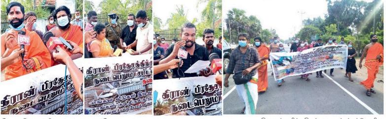
செய்யப்பட்டு வருகிறது. இதற்கு முன்பு மணல் அகழ்வலை மீண்டும் தொடங்கிவிட்டதை அங்குள்ளவர்கள் சாட்சியங்களை எடுக்க வேண்டும் என்று கோரிக்கையிட்டு வருகிறது.

இது தடுக்கப்பட்டு வருகிறது. இதற்கு முன்பு மணல் அகழ்வலை மீண்டும் தொடங்கிவிட்டதை அங்குள்ளவர்கள் சாட்சியங்களை எடுக்க வேண்டும் என்று கோரிக்கையிட்டு வருகிறது.