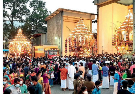
மாத்தளை அருள்மிகு ஸ்ரீ குத்துமாரியம்மன் தேவஸ்தான பஞ்சரத பவனி நேற்று மாலை கோயிலில் இருந்து புறப்பட்டது. வீதியிலாவை நிறைவேற்றும் இன்று பஞ்சரதங்கள் கோயிலை சென்றடைந்தது. தேர்த்திருவிழாவில் பெருமளவான பக்தர்கள் கலந்துகொண்டனர்.