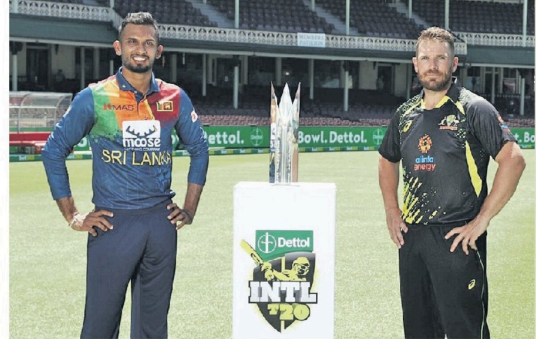
முற்றான இலங்கை - அவுஸ்திரேலிய அணிகளுக்கிடையிலான நான்காவது இருபதுக்கு 20 சர்வதேச போட்டி இன்று மெல்போர்ன் கிரிக்கெட் மைதானத்தில் இலங்கை நேரப்படி பிற்பகல் 1:40 மணிக்கு ஆரம்பமாகிறது.

தங்கள் சாதகத் தலைமையிலான இலங்கை கிரிக்கெட் அணியானது அவுஸ்திரேலிய அணியுடன் 5 போட்டிகள்கொண்ட இருபதுக்கு 20 சர்வதேச தொடரில் விளையாடுவதற்காக அவுஸ்திரேலியாவுக்கு சுற்றுப்பயணம் மேற்கொண்டுள்ளது. தொடரின் முதல் மூன்று போட்டிகளில் வெல்லிதேரோவர் அணி வெற்றிபெற்றது தொடரே தலைவாசப்படுத்தி இருக்கும் நிலையில், இலங்கை அணி தொடர் தோல்விகளுக்கு முற்றுப்புள்ளி வைக்கும் வகையில் இன்று களமிறங்குகிறது. அண்மையில் நடைபெற்ற இரண்டாவது இருபதுக்கு 20 சர்வதேச போட்டியின்போது இலங்கை அணி சுப்பர் ஓவரில் வெற்றியை கோட்டை விட்டமை குறிப்பிடத்தக்கது. 2022ஆம் ஆண்டிற்கான ஐ.சி.சி. இருபதுக்கு 20 உலகக் கிண்ணத் தொடர் இன்று 8 மாதங்களை அவுஸ்திரேலியாவில் ஆரம்பமாகவுள்ள நிலையில், இலங்கை அணி இவ்வாறு தொடர்ச்சியாக தோல்விகளை தழுவிக்கொண்டு வருகின்றன ரசிகர்கள் மத்தியில் சோகத்தை ஏற்படுத்தியுள்ளது.