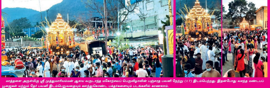
மாத்தளை அருள்மிகு ஸ்ரீ முத்துமாரியம்மன் ஆலய வருடாந்த மகோற்சவப் பெருவிழாவின் பஞ்சரத பவனி நேற்று (17) இடம்பெற்றது. இதன்போது வந்த மண்டபப் பூஜைகள் மற்றும் தேர் பவனி இடம்பெற்றவதையும் காண்கொண்ட பக்தர்களையும் படங்களில் காணலாம்.