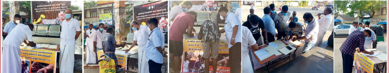
(யாழ். திருபு) பயங்கரவாதத் தடைச் சட்டத்தை தடை செய்க்கோரி கையெழுத்துப் போராட்டம் நேற்று யாழ்ப்பாணம், அச்சுவேலி பிரதான பஸ் நிலையத்தில் இடம்பெற்றது. பயங்கரவாதத் தடைச் சட்டத்தின் கீழ் இளைஞர், யுவதிகள் விசாரணையின்றி கைதுசெய்யப்பட்டு நீண்டகாலமாக சிறைகளில் அடைத்துவைக்கப்பட்டுருப்பதன் மிகவும் மோசமான சட்ட ஏற்பாடுகளைக்கொண்டிருக்கிறார்கள். அந்த சட்டத்தின் கீழ் நிக்ர்ப்பட்ட வேண்டுமெனத் தீவிர சிபிடிக்கப்பட்டுள்ள தொடர்ச்சியான கையெழுத்துப் போராட்டத்தை முன்னெடுத்து வருகின்றனர். குறித்த கையெழுத்துப் போராட்டத்தில் பயங்கரவாதத் தடைச் சட்டம் நிக்ர்ப்பட்ட வேண்டுமெனத் தீவிர சிபிடிக்கப்பட்டுள்ள தொடர்ச்சியான கையெழுத்துப் போராட்டத்தை முன்னெடுத்து வருகின்றனர். குறித்த கையெழுத்துப் போராட்டத்தில் பயங்கரவாதத் தடைச் சட்டத்தை நிக்ர்ப்பட்ட வேண்டுமெனத் தீவிர சிபிடிக்கப்பட்டுள்ள தொடர்ச்சியான கையெழுத்துப் போராட்டத்தை முன்னெடுத்து வருகின்றனர். குறித்த கையெழுத்துப் போராட்டத்தில் பிரதான பஸ் நிலையத்தில் நாடாளுமன்ற உறுப்பினர் எம். ஏ. சுமந்திரன் தலைமையிலான அணிமீள கையெழுத்தினை பொது மக்களிடமிருந்து பெற்றுக்கொண்டமை குறிப்பிடத்தக்கது.