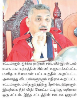
சட்டமானது. தூக்கம் தடுக்கல் செயல்படுத்தப்படும். உருவமான மாண்புமிகு சிறைத் தண்டனை எம்.பி. சி.வி.வித்தர்.

பயங்கரவாதத் தடைச் சட்டமானது உண்மையில் வேறுமாதிரியானதல்ல. மனிதகுலத்திற்கு தேவையற்றதாகும் - என உருவமான மாண்புமிகு சிறைத் தண்டனை எம்.பி. சி.வி.வித்தர்.