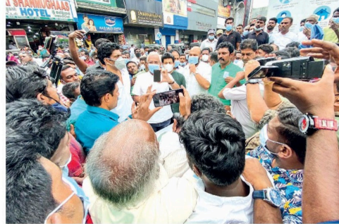
தமிழ் முற்போக்குக் கூட்டணியினர் அரசாங்கத்துக்கு எதிராக ஹட்டளில் நெற்று மாவட்டம் போராட்டமென்று ஏற்பாடு செய்யப்பட்டிருந்தது. இதில் பயங்கரவாதத் தடைச் சட்டத்துக்கு எதிராக கையெழுத்துப் போராட்டத்தில் ஈடுபட்டிருந்த நாடாளுமன்ற உறுப்பினர்களான எம்.ஏ.சுமந்திரன், இரா.சாணக்கியன் ஆகியோரும் கலந்துகொண்டனர்.