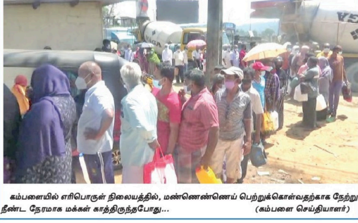
மல்வெலியில் எரிபொருள் நிலையத்தில், மன்னென்செய் பெற்றுக்கொள்வதற்கான நேற்று நீண்ட நேரமாக மக்கள் காத்திருந்தபோது... (மல்வெலியை செய்தியாளர்)

தலவாக்கலை எரிபொருள் நிலையங்களில் கட்டுதல் சில நாட்களாக ஊடல் தட்டுப்பாடு காரணமாக தலவாக்கலையிலிருந்து பல தோட்டப் பாதைகளுக்கான தனியார் பஸ் சேவைகள் பாதிப்படைந்துள்ளன. தனியார் பஸ் சாரதியின் தெரிவித்தது. எரிபொருள் தட்டுப்பாடு காரணமாக நேற்று (06) தலவாக்கலையிலுள்ள எரிபொருள் நிலையங்களில் பஸ்கள் மற்றும் ஏனைய வாகனங்கள் நீண்ட வரிசையில் காத்திருப்பதைக் காணமுடிந்தது. 2, 3 நாட்களுக்கு ஒருமுறை எரிபொருள் நிலையங்களுக்கு அனுப்பப்படும் பஸ்கள், நிறுத்தப்படும் வாகனங்களுக்கு கூட போதாது என்று, தனியார் பஸ்களுக்கு முன்னுரிமை வழங்க அதிசாரிகள் நடவடிக்கை எடுக்க வேண்டும் என்று சாரதியின் தெரிவிக்கின்றனர். தலவாக்கலையிலிருந்து புறப்போயுபவர்கள் சேவைகளை, எல்லி, உயகம், சென் கூம்ஸ், மடக்கமும்பு, மட்டுக்கலை, நோளாமைத்தை, போப்பத்தலவ ஆகிய பகுதிகளுக்கு செல்வ நாள்நாள் பெருந்தோட்ட மக்கள் பல்களைப் பயன்படுத்துகின்றனர். இதனால் மக்கள் பல்வேறு அபேசகரியங்களுக்குள்ளிட வருவதற்கான சாரதியின் தெரிவிக்கின்றனர். இதனால் மலையக தேசிய கலைத் தோட்டங்களின் அன்றாட நடவடிக்கைகளும், மரக்கறிப் போக்குவரத்தும் பாரியளவில் பாதிக்கப்பட்டுள்ளன குறிப்பிடத்தக்கது.