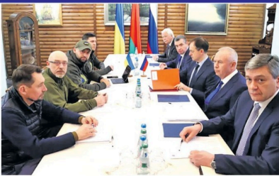
பேரள நிறுவனத்தின் மொத்தப் பரிசீலனை ரஷ்யப் பகுதி என்று உக்ரைன் அறிவிக்க வேண்டும்

உக்ரைன் - ரஷ்யா இடையேயான நான்காம் கட்ட பேச்சுவார்த்தை துவக்கியிருக்கிற நிலைமை நடைபெற்று என தகவல் வெளியாகியுள்ளது. உக்ரைன் மீதான ரஷ்யாவின் இராணுவ நடவடிக்கை இன்று 14-ஆவது நாளான சனவரியில் நடைபெற்று, தலைநகர் கீவ்வை நோக்கி ரஷ்யப் படைகள் தொடர்ந்து முன்னேறி வருகிறது. நேற்றுமுன்தினம் போலந்துவில் நடைபெற்ற முன்றலம் உட்பேச்சுவார்த்தையில் இரு நாடுகள் இடையே ஊடக உடன்படிக்கை ஏற்பட்டது. நான்காம் கட்ட பேச்சுவார்த்தை நாளைய 10.30 மணிக்கு அன்ஹாபரன் ஐ.டி.எம்.டி.யில் நடைபெறும் என உக்ரைன் வெளியுறவுத்துறை அமைச்சர் தெரிவித்துக்கொண்டார்.