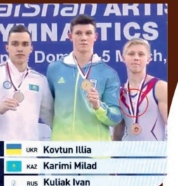
சர்வதேச ஜிம்னாஸ்டிக் கூட்டமைப்பு வெறித்துள்ளது. இது அடிப்படையில் அவருக்கு எதிரான ஒழுக்கப்பற்ற விசாரணைகள் ஆரம்பிக்கப்பட்டுள்ளன. உக்ரைன் வீரர் ஆசியப்படி நடவடிக்கை ரஷ்யா இவரது விசாரணை மட்டுமே ரஷ்ய மற்றும் வெளியே வீரர்களுக்கு போட்டியில் பங்கேற்கக்கூடிய வாய்ப்பு வழங்கப்படும் என சர்வதேச ஜிம்னாஸ்டிக் கூட்டமைப்பு அறிவித்துள்ளது.

ரஷ்ய ஜிம்னாஸ்டிக் வீரர் இவரின் குலியாக், ரஷ்ய இராணுவம் பயன்படுத்தும் னு என்ற அடையாளத்தை தமது ஆடையில் பொறித்திருந்ததை தொடர்ந்து விசாரணைகள் ஆரம்பிக்கப்பட்டுள்ளன. கடாசியில் உடந்த சனிக்கிழமை நடைபெற்ற ஜிம்னாஸ்டிக் போட்டி மேடையில் உக்ரைனிய வீரர் அருகில் இருந்த சந்தர்ப்பத்தில், அவர் குறித்த சிங்களத்தை வெளியிடுவதில் இருந்ததால் சர்வதேச தகவல்கள் தெரிவிக்கின்றன. உக்ரைன் வீரர் ஆசியப்படி நடவடிக்கைகளை ரஷ்யா முன்னெடுத்துள்ள நிலையில், அவரது செயற்பாடு அதிகாரத்தை ஏற்படுத்தியுள்ளது.