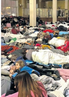
உக்ரைன் ஜனாதிபதி செலென்ஸ்கி தெரிவித்துள்ளார்.

கீவ்வில் குண்டு தாக்குதல்: 13 பேர் உயிரிழப்பு கீவ் நகரில் ரஷ்ய இராணுவம் குண்டுவிசை தாக்குதலை மேற்கொண்டுள்ளது. இப்பகுதியில் சுமார் 30 பேர் செக்கி பகுதியில் இருந்ததாக தெரிவிக்கப்பட்டுள்ளது. இத்தாக்குதலில் 13 பேர் உயிரிழந்துள்ளதாக தெரிவிக்கப்படுகிறது. மேலும் இடிபாடுகளில் சிக்கி 5 பேர் மீட்கப்பட்டுள்ளதாக அவசர