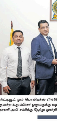
இன்ஸ்டிடியூட் ஒப் பொலிவிக்ஸ் (Institute Of Politics) நிறுவனத்தினால் வருடந்தரம் நாடாளுமன்ற உறுப்பினர் ஒருவருக்கு வழங்கும் விசேட விருது நிதி அமைச்சர் ஜனாதிபதி சட்டத்தரணி அலி சபீர்க்கு நேற்று முன்தினம் (07) வழங்கப்பட்டது.

(அழகுநகரம் செய்தியாளர்) யாழ்ப்பாணம் - கண்டி 9 பிள்ளை விதியில் கெக்கிராவர், வைகாசி பகுதியில் நேற்று முன்தினம் (07) இடம்பெற்ற மோட்டார் சைக்கிள் விபத்தில் நபரொருவர் சம்பவ இடத்தில்யே உயிரிழந்துள்ளதாக கெக்கிராவர் பொலிஸார் தெரிவித்தனர். சம்பவத்தில் படுகாயமடைந்த மேலும் ஒருவர் கெக்கிராவர் வைத்தியசாலையில் சேர்க்கப்பட்டுள்ளார். இச்சம்பவம் நேற்று பிற்பகல் வேளையில் வைகாசி பகுதியில் இடம்பெற்றுள்ளதாக விசாரணைகளை மேற்கொண்டபொலிஸார் தெரிவித்தனர். சம்பவத்தில் 18 வயதுடைய இப்போகை பகுதியைச் சேர்ந்த இளைஞன் ஒருவரே உயிரிழந்துள்ளார் என்பது தெரிவித்துள்ளது. சம்பவம் பற்றி மேலும் தெரிவிப்பதற்காக