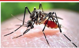
பாதிக்கப்பட்டிருக்கின்றமை தரவுகள் மூலம் கணிக்கப்பட்டுள்ளது. டெங்கு நோயின் தாக்கத்தை உணர்ந்து