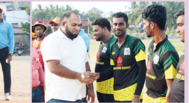
கோல்டல் யோரியல் அணியின் தனக்கு வழங்கப்பட்ட 20 ஓவர்களில் 126 ஓடங்களை நெற்றினர். பதினாறு துடுப்பெடுத்தாயு முத்தகின் அணியினர் 18 ஓவர்களில் வெற்றி இலக்கை அடைந்தனர். இந்திசுருக்கு பிரதம அதிபியாக கடமுனை