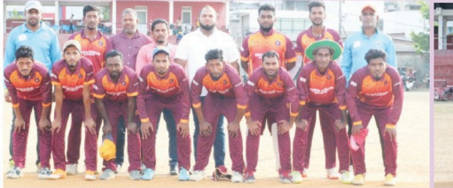
(கடமுனை நிறுபர்) கடமுனை லெஜன்ஸ் விளையாட்டுக் கழகம் தனது 13ஆவது ஆண்டு நிறுவன முன்னிட்டி ஏற்பாடு செய்யப்பட்ட பஞ்சு தேவின் சவால் கிண்ணம் இருபத்தாறு 20 கிரிக்கெட் கற்பு போட்டி, உத்த வாரம்