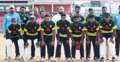
(கடமுனை சந்தரங்கேனி மொனாத்தி ஆரம்பமாவது) தெனாடின் முதல் போட்டி நித்தர்ப்பு முத்தகின் மதறும் மருமுனை சோல்டல் யோரியல் அணிசுருக்கினடயில் இடம்பற்றறது. போட்டியில் முதலில் துடுப்பெடுத்தாயு