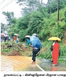
நாலைப்பட்டி - கிளித்தோரை பிரதான பாதையில் மீட்டிய பகுதியில் நேற்று பிழங்கு மண்செய்ய ஏற்பட்டதால் வாகனப் போக்குவரத்துக்கு இடையூறு ஏற்பட்டது.

அமைச்சர் வைத்து மரியாதை நிமித்தம் சந்தித்தார். இந்தச் சந்திப்பு கடந்த ஜூன் 29 ஆம் திகதி இடம்பெற்றதாக வெளிநாட்டு அலுவலர் அமைச்சர் தெரிவித்துள்ளார். இவர்களுக்கு பாகிஸ்தானுக்கும் இடையில் அபிவிருத்தியை நோக்கி இரண்டு உறவுகள் குறித்து வெளிநாட்டு அலுவலர்கள் அமைச்சர் கவனத்து ஈடுபட்டிருந்தனர். பல துறைகளில் நடைபெறும் ஒத்துழைப்பு குறித்து திருத்திய வெளிப்படுத்துகின்றனர். இது வழி உறவுகளை வலுப்படுத்துவதற்கான வழிமுறைகளை மக்களுக்கு இடையிடையே தொடர்புகளை வலுப்படுத்துவதற்கு அவர்கள் தீர்மானித்தனர். பல்வேறு பிராந்திய மற்றும் சர்வதேச அரங்குகளில் கடினமான காலங்களில் பாகிஸ்தான் அரசாங்கம் வழங்கிய உதவியை மீண்டும் நிலையான ஆதரவை அமைச்சர் பாராட்டினார்.