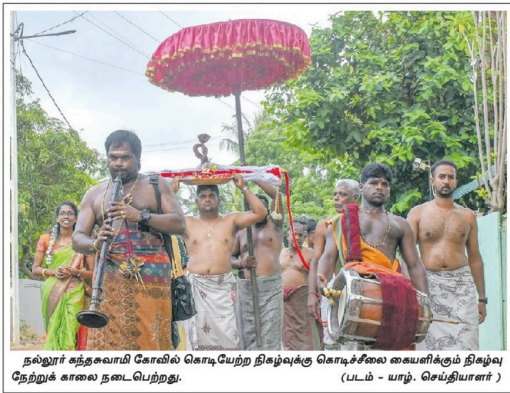
நல்லூர் கந்தசுவாமி கோவில் கொடியேற்ற நிகழ்வுக்கு கொடிச்சலை வையாவிக்கும் நிகழ்வு நேற்றுக் கலை நடைபெற்றது.