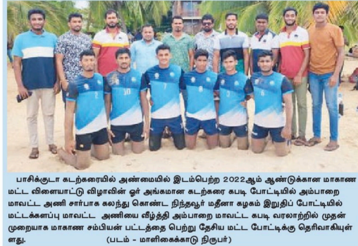
பாசிகுடா உடற்கலையில் அண்மையில் இடம்பெற்ற 2022ஆம் ஆண்டுக்கான மாகாண மட்ட விளையாட்டு விழாவின் ஓர் அங்கமான உடற்கலை கைப் போட்டியில் அப்பாறை மாவட்ட அணி சார்பாக லைண்ட் நித்தியூர் மீதான வழம் இறுதி போட்டியில் மட்டக்களப்பு மாவட்ட அணிவை வீழ்த்தி அப்பாறை மாவட்ட கைப் போட்டியில் முதன் முறையாக மாகாண சம்பியன் பட்டத்தை பெற்று தேய் மட்ட போட்டிக்கு தெரிவாகியுள்ளது. (மட்டம் - மாணிக்காடு திருபதி)

இங்கிலாந்து கிரிக்கெட் அணியானது 17 ஆண்டுகளின் பின் பாகிஸ்தானின் மண்ணுக்கு சுற்றுப்பயணம் மேற்கொண்டு ஏழு போட்டிகளை இடம்பூத்து 20 சர்வதேச தொடரில் விளையாடுகிறது. அதன்படி, அடுத்த மாதம் 20ஆம் திகதி முதல் ஒக்டோபர் மாதம் 2ஆம் திகதி வரையில் குறித்த ஏழு இருபதுக்கு 20 போட்டிகளும் சார்ச்சி மற்றும் லாஹூரில் நடாத்தப்படவுள்ளன. அவ்லத்திரேவியாவில் நடைபெடுவான இருபதுக்கு 20 உலகக் கிண்ணத் தொடருக்கு தயாராகும் வகையில் குறித்த தொடர் ஒழுங்கு செய்யப்பட்டுள்ளது. இதன் பின்னர் இங்கிலாந்து அணி மீண்டும் டிசம்பர் மாதத்தில் பாகிஸ்தானுக்கு சுற்றுப்பயணம் மேற்கொண்டு மூன்று போட்டிகள் கொண்ட டெஸ்ட் தொடரிலும் ஆடிவளங்களை இங்கிலாந்தின் ஆடவர், மகளிர் கிரிக்கெட் அணிகள் கடந்த ஆண்டு பாகிஸ்தானுக்கு கிரிக்கெட் சுற்றுப்பயணங்களை மேற்கொள்ளவிருந்தபோதிலும் குறித்த சுற்றுப்பயணங்கள் வீர, வீரமங்களைக் கொவிட்-19 பாதுகாப்பு வலயத்திற்குள் இருந்ததன் மூலம் ஏற்பட்ட அழுத்தம் மற்றும் வீர, வீரமங்களைகளின் உடறமை என்பவற்றினை கருத்திற்கொண்டு இருந்துச் செய்யப்பட்டிருந்தமையும் குறிப்பிடத்தக்கது.