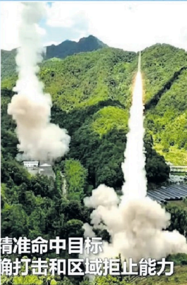
செனடிம் நான்சி உள்ளது சீன வெளியுறவுத்துறை செய்தித் தொடர்பாளர் ஹுவா சன்யியம் தெரிவித்துள்ளார்.

ஏற்கனவே பொருளாதார சிக்கல்கள் மற்றும் இந்நகரம் சீனாவுக்கு சிக்கல்கள் உள்ளதால், இராணுவ நடவடிக்கையை முன்னிறுத்தியே சீனா அத்து பதிவுகளை செனடிம் என்ற கூறப்படுகிறது. இதனிடையே, சீனாவின் கடல் எல்லைப்பயணம் மீறி தாய்வாளுக்கு நான்சி, நேற்றுமுந்தினம் தனி விமானம் மூலம் அமெரிக்கா முடிப்பட்டுச் சென்றார். தமது தாய்வான் பயணம் குறித்து டிடெட்டிப் பதிவிட்டுள்ள அவர்,