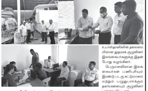
உயர்ந்ததனிசினர் தலைமையிலான துறக்க குழுவின் இலங்கையர்களுக்கும் இடம் பெறுவதற்கான உதவியும் பெறுகின்றனர்.

மாலை தீவிலுள்ள இலங்கை உயர்ந்ததனிசினரால் மாலைதீவில் உள்ள தீவிரவாதிகளால் மாலைதீவில் உள்ளவர்கள் மாலைதீவில் உள்ளவர்களை அண்மையில் ஏற்பாடு செய்திருக்கிறது. 2022 மார்ச் 17ஆம் திகதி ஹம்மா மாலே தீவில் மிகவும் வெற்றிகரமாக இடம்பெற்ற தொடக்க நிஷுவிற்புட்டி உள்ளது. இதுபோன்ற நடமாடும் சேவை இடம்பெற்ற இடங்களுக்கு சந்தர்ப்பம் இதுவாகும்.