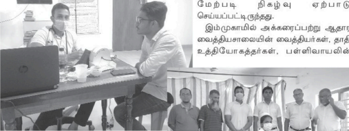
மேற்படி நிகழ்வு ஏற்பாடு செய்துள்ள அக்கரைப்பற்று ஆதார வைத்தியசாலையின் வைத்தியர்கள், தாதி உத்தியோகத்தர்கள், பள்ளிவாசலின்

(அட்டானை மத்ய நிருபர்) அக்கரைப்பற்று ஆதார வைத்தியசாலை இரத்த வங்கிக்கு அன்பளிப்புச் செய்யும் நோக்கில் "உதிரை கொடுத்து உயிர் காக்க உதவுவோம்" எனும் சொல்லிப்பொருள் அக்கரைப்பற்று இஸ்லாமிய கலாசார வழிகாட்டல் மையத்தினால் ஏற்பாடு செய்யப்பட்ட மாபெரும் இரத்ததான முகாம் அக்கரைப்பற்று அஹ்லுஸ்ஸான்னா ஜும்ஆ பள்ளிவாசலில் அண்மையில் (24) நடைபெற்றது. அக்கரைப்பற்று ஆதார வைத்தியசாலை, வைத்திய அத்திட்டம் எந்திய சைந்தி அனாத்தி எம்.ஹலிப்பின் வேண்டுகோளுக்கிணங்க இரத்தப் பற்றாக்குறையைக் குறைத்தகொண்டு மருகுமர்கள், திருவாகிகள் ஆகியோர் ஒதுழைப்பு நல்கியதுடன், இதில் ஆண்கள், பெண்கள் என பெரும்பாலான இரத்தக் கொடையாளர்கள் ஆர்வத்தோடு கலந்துகொண்டு இரத்ததானம் வழங்கியதுடன், இதில் 157 இரத்த மாந்திகள் சேகரிக்கப்பட்டமை குறிப்பிடத்தக்கது.