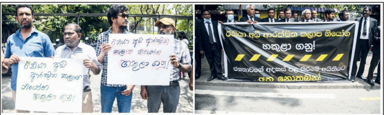
சட்டத்தரணிகள் மற்றும் மக்கள் எதிர்ப்பு ஆரம்பப்பட்ட நேற்று (27) புதுக்கடை நீதிமன்ற கட்டிடத் தொகுதியின் முன்னால் இடம்பெற்றது.