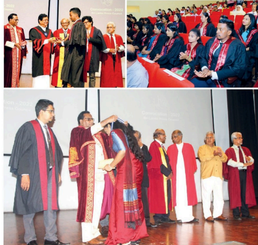
இதழியல் மற்றும் ஊடகக் கற்கைகள் டிப்ளோமா கற்கைநெறிப்பின் 6 ஆவது அணிபினருகளையும்