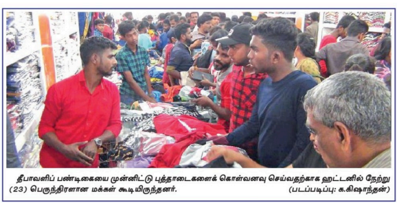
தீபாவளிப் பண்டுகளை முன்னிட்டு புத்தாடைகளைக் கொள்வனவு செய்வதற்காக ஹட்டனில் நேற்று (23) பெருந்திரளான மக்கள் கூடிநின்றனர்.