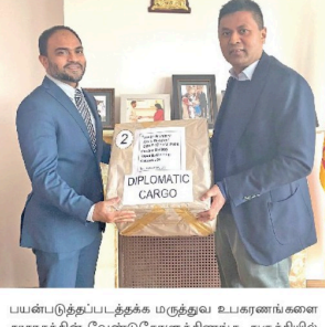
கொவிட்-19 நேற்றையக் கட்டுப்படுத்துவதற்காக இலங்கையிலுள்ள அரசாங்க மருத்துவமனைகளில்