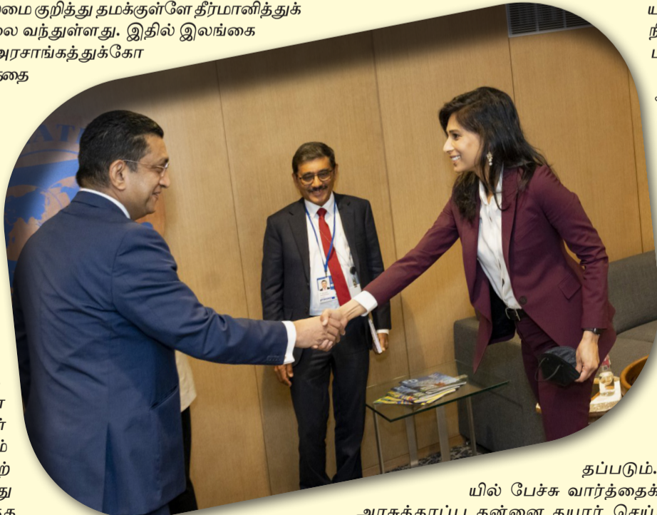
நிதிகளுடன் பேச்சு வார்த்தை செய்வதற்கு அவர்களிடம் ஒற்றுமை இல்லை என்பது நடைமுறை இலங்கைத் தலைவர் ரணில்

இந்த வகையில் பேச்சு வார்த்தைக்கு இலங்கை அரசுத்தரப்பு தன்னை தயார் செய்ய முடியாது போனால் அங்கத்தவர்கள் மத்தியில் பாராளுமன்றத்தில் போடும் சண்டைகள் மேலும் இலங்கைத் தீவில் யாரிடம் ஒற்றுமையில்லை என்பதையும் எடுத்துக்காட்ட வாய்ப்பாக அமையும் என்றே தெரிகிறது.