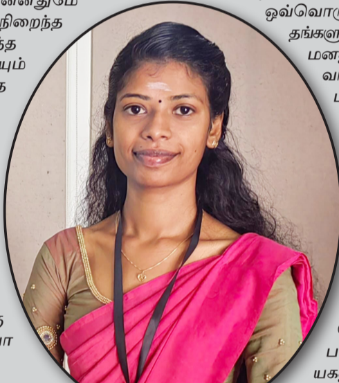
பா.கனகேஸ்வரி உடக கற்கைகள் துறை யாழ்ப்பல்கலைக்கழகம்

சங்கடங்கள் இருந்த போதிலும் சந்தோசமாக வாழும் லயன் வாழ்க்கை நாகரிகத்தால் பிரிந்து போகாத கூட்டுக் குடும்பமே!