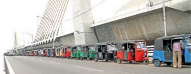
கொழும்பின் பல பகுதிகளிலும் மக்கள் எரிபொருள் பெற்றுக்கொள்வதற்காக நேற்று (18) காத்திருந்தனர்.