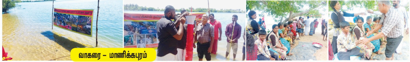
வாகரை - மாணிக்கபுரம்