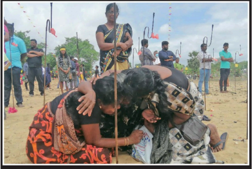
இறுதிப்போரில் படுகொலை செய்யப்பட்ட தங்களுடைய உறவுகளை நினைவுகூர்ந்து முள்ளிவாய்க்கால் நினைவுதூங்கி அருகில் சிறியமும் உறவுகள். (யாழ் செய்தியாளர்)