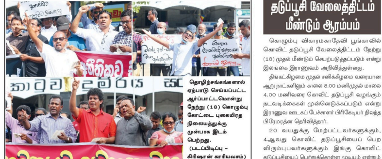
தொழிற்சங்கங்களால் ஏற்பாடு செய்யப்பட்ட ஆர்ப்பாட்டமொன்று நேற்று (18) கோரும்பு கோட்டை புகையிரத முன்பாக இடம்பெற்றது.