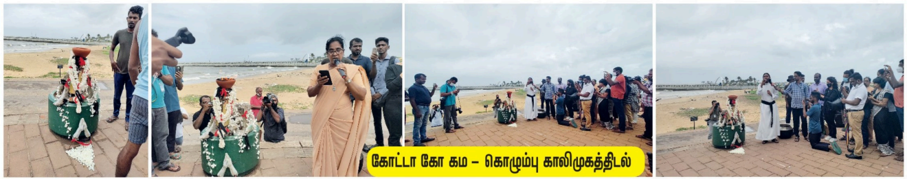
கோட்டா கோ கம் - கொழும்பு காலிமுகத்தீவல்