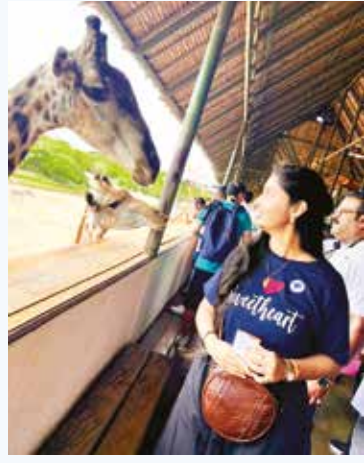
உருவாக்கி, கொண்டாட்டத்திற்கு தனிப்பட்ட தொடர்பைச் சேர்க்கும் நேரத்தைச் செலவிட்டனர்.

ளவும், மகிழ்ச்சியான நிகழ்வுகளைக் கொண்டாடவும் உரிய நேரமாகும். பல ஆண்டுகளாக, விடுமுறைகள் அனுசரிக்கப்படும் விதம் குறிப்பிடத்தக்க மாற்றங்களுக்கு உள்ளாகி வந்துள்ளது. இது சமூக நெறிமுறைகள், தொழில்நுட்ப முன்னேற்றங்கள் மற்றும் வாழ்க்கை முறை தேர்வுகளில் ஏற்படும் மாற்றங்களை பிரதிபலிக்கிறது. பழைய நாட்களை நோக்கி ஒரு ஏக்கம் நிறைந்த பயணத்தை மற்றும் முந்தைய ஆண்டுகளின் விடுமுறை மரபுகளை இன்றைய சமகால கொண்டாட்டங்களுடன் ஒப்பிடுகையில் அக் கால விடுமுறைகள் எளிய மரபுகளை கொண்டிருந்தது. தொழில்நுட்பங்கள் அதிகமில்லா காலகட்டத்தில் தொடர்புகொள்ளாதல் என்பது நேருக்கு நேர் தொடர்பு அல்லது கையால் எழுதப்பட்ட கடிதங்களுக்கு மட்டுப்படுத்தப்பட்டது. அஞ்சல் மூலம் அனுப்பப்பட்ட அட்டைகள் மூலம் விடுமுறை வாழ்த்துகள் பரிமாறப்பட்டன. மேலும் இந்த அட்டைகளைப் பெறுவதற்கான எதிர் பார்ப்பு பண்டிகைக் காலத்தில் கூடுதல் உற்சாகத்தை சேர்த்தது.