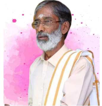
இளைப்பாறிய அதிபர் மு.அருணாசலம்