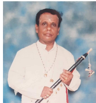
நாதஸ்வர வித்துவான் இ.கேதீஸ்வரன்