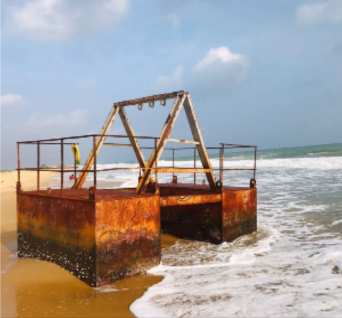
நாகர்கோவில் கிழக்கு கடற்கரைப்பகுதியில் இன்று வத்தையை போன்ற மிதவை ஒன்று கரை ஒதுங்கியது.