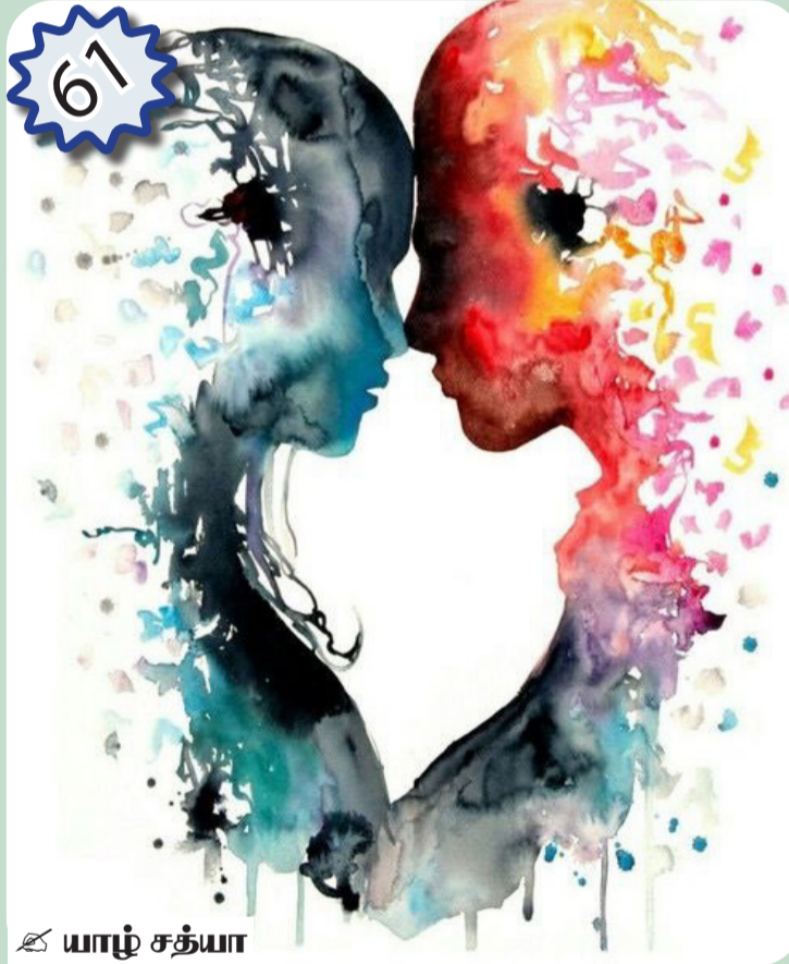
ஔ யாழ் சத்யா

அடுத்த நாள் அந்த விடுதியைக் காலி செய்து கொண்டு நுவரெலியாவுக்குப் போய் அங்கே நட்சத்திர விடுதி ஒன்றில் அறை எடுத்துக் கொண்டார்கள். சீதாஸியக்குச் சென்று அங்கே இராவணன் சீதையை சிறைபிடித்து வைத்த காலத்தில் அனுமன் தூது வந்த நேரத்தில் பதித்து விட்டுச் சென்ற பாத அடையாளத்தை வணங்கினார்கள். அப்படியே அங்