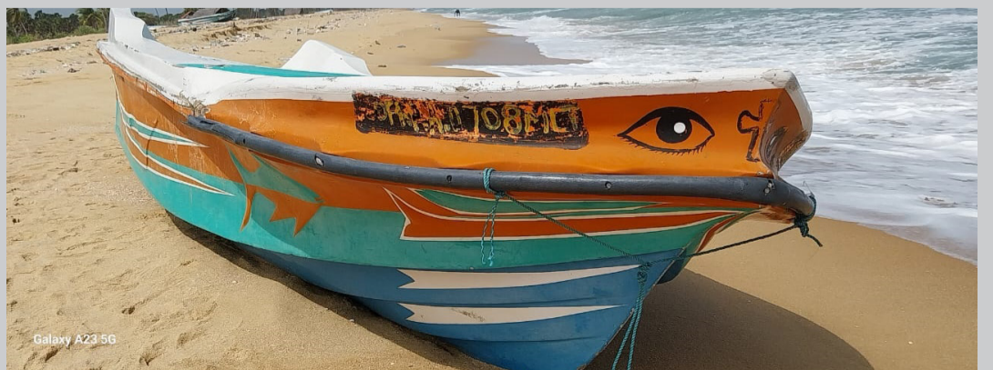
Galaxy A23 5G

இதேவேளை வடமராட்சி கிழக்கு உடுத்துறையில் பௌத்த கொடியுடன் மிதப்பு ஒன்றும், மூடிய கொள்கலன் ஒன்றும் கரை ஒதுங்கியது. அதேவேளை நாகர்கோவில் பகுதியிலும் மரத்தினாலான மிதப்பு ஒன்றும் கரை ஒதுங்கியிருந்தது. ■