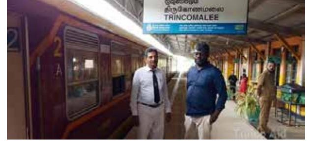
துறையின் ஆதரவோடும் நடைமுறைப்படுத்தப்படுகின்றது.

இப்பசுமை நிலையமானது Lion Club of Trincomalee Town, Lion Club of Centennial Paradise ஆகியவற்றின் அனுசரணையோடும் கிழக்கு மாகாண சுற்றுலாத்