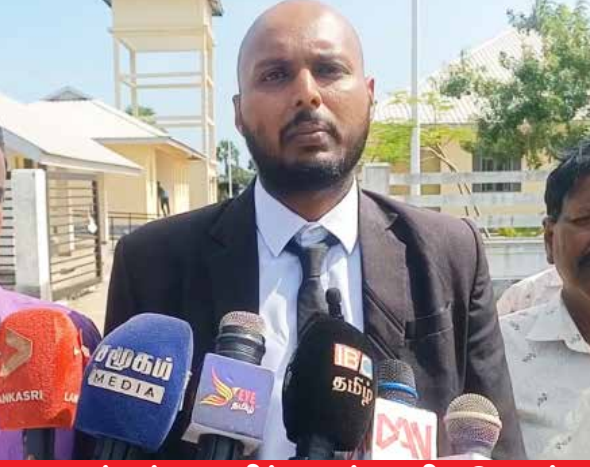
குருந்தூர் மலையில் பௌத்த வழிபாடுகளுக்கு இடையூறு விளைவிக்கப்பட்டதாக கூறப்பட்டு தாக்கல் செய்யப்பட்ட வழக்கானது முல்லைத்தீவு நீதிமன்றத்திலே இன்றையதினம் எடுத்து கொள்ளப்பட்டது.