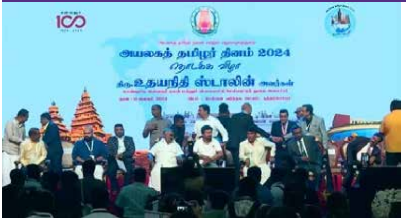
சென்னையில் தமிழக அரசால் நடத்தப்படும் அயலகத் தமிழர் தின விழா இன்று ஆரம்பமானது.