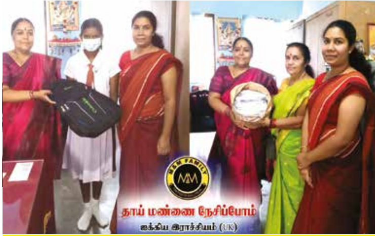
வெற்றிமணியூடாக, இங்கிலாந்து M & M family நிறுவனத்தினர் உதவி

மழை வெள்ளத்தால் பாதிக்கப்பட்ட நாவலப்பிட்டி கதிரேசன் இந்து மகளிர் கல்லூரி மாணவர்களுக்கு அதிபரினூடாக பாசாலை ஸ்கூல் பாக்ஸ் மற்றும் சொக்ஸ், என்பன வழங்கப்பட்டன. இதன் மூலம் 50 மாணவர்கள் பயன்