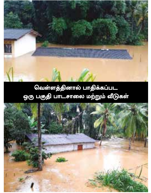
வெள்ளத்தினால் பாதிக்கப்பட்ட ஒரு பகுதி பாடசாலை மற்றும் வீடுகள்