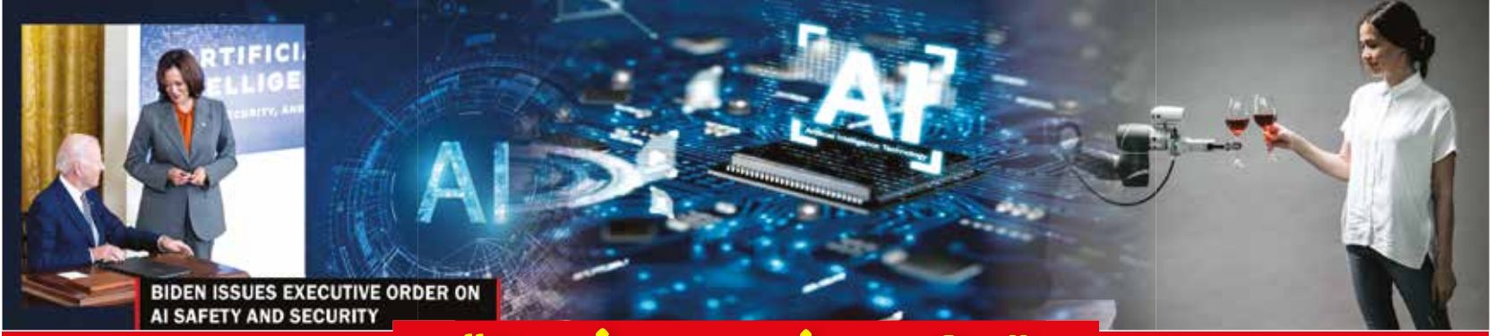
BIDEN ISSUES EXECUTIVE ORDER ON AI SAFETY AND SECURITY