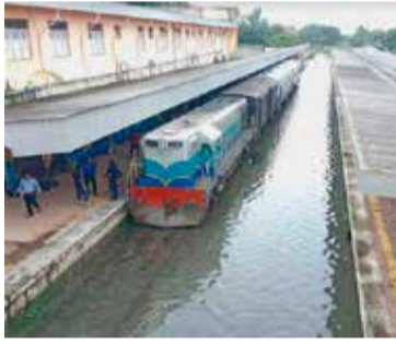
மத்திற்குள்ளா கியுள்ளதாகவும் தெரிவிக்கப்பட்டுள்ளது. (அ)

மட்டக்களப்பு, ஜன. 11 நாட்டில் தொடர்ச்சியாக பெய்து வரும் கனமழை காரணமாக, மட்டக்களப்பு மாவட்டத்தின் பல பிரதேச செயலாளர் பிரிவுகளின் தாழ் நில பிரதேசங்கள் வெள்ளத்தில் மூழ்கியுள்ளன. அத்தோடு மட்டக்களப்பு ரயில் நிலையமும் வெள்ளத்தில் மூழ்கியுள்ளது. மேலும் ரயில் பயணங்களை மேற்கொள்ளும் பயணிகள் சிர