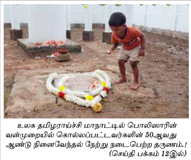
உலக தமிழராய்ச்சி மாநாட்டில் பொலிஸாரின் வன்முறையில் கொல்லப்பட்டவர்களின் 50ஆவது ஆண்டு நினைவேந்தல் நேற்று நடைபெற்ற தருணம். (செய்தி பக்கம் 12இல்)