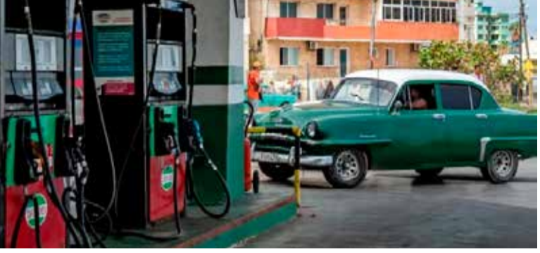
அதன்படி, எதிர்வரும் பெப்ரவரியில் இருந்து ஒரு லீற்றர் பெற்றோலின் விலை 25 கியூப பெசோவில் இருந்து, 132 பெசோவாக அதிகரிக்கப்படவுள்ளது. டீசல் மற்றும் ஏனைய எரிபொருட்களின் விலையும் அதி

ஹவானா, ஜன. 11 எரிபொருள் விலையினை ஐந்து மடங்காக அதிகரிப்பதாக கியூபா அறிவித்துள்ளது. கியூபா அரசாங்கம் எரிபொருள் மற்றும் கடுமையான பொருளாதார நெருக்கடியுடன் போராடி வரும் நிலையில் இந்த அறிவிப்பினை வெளியிட்டுள்ளது.