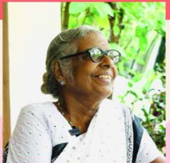
தொகுப்பும் பதிப்பும் கலாமணி பரணீதரன்