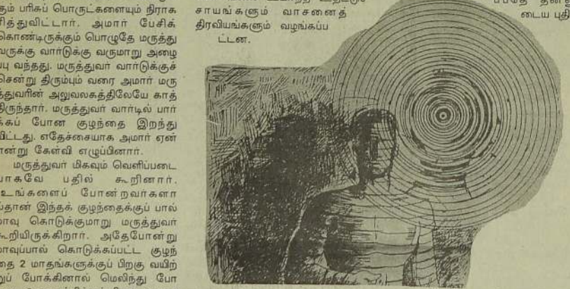
நீங்கனும் படிக்கலாம் சில குறிப்புகள்...

ஆனால் நெல்லேதான் பெரிய கம்பெனி ஆயிற்று. தன்னுடைய சக்தியையும் பயன்படுத்தி அமாரின் அறிக்கைகளைப் பொய்யாக்கும் பொருட்டு அடுத்த மேயில் தன்னுடைய சொந்த அறிக்கையைத் தயார் செய்து வெளியிட்டது. நெல்லே உலகத்திலேயே மிகப் பெரிய உணவு நிறுவனமாகும். உலகமேயே சந்தைக்கு வரும் குழந்தைகள் உணவுகளில் 40 சதவீதம் நெல்லேயேயுடையதுதான். பாகிஸ்தானில் ஒவ்வொரு வருடமும் 10 லீட் மாள குழந்தைகள் ஒரு வயது ஆவதற்குள்ளாகவே இறந்துவிடுகின்றனர். பாகிஸ்தான் குழந்தை இறப்புக்கு மாவுப் பாலினால் ஏற்படும் வயிற்றுப் போக்கு மற்றும் சுலாசிய குழாய் தொற்றுநோய் முக்கிய காரணம் என்று குழந்தை நல நிபுணர்கள் கூறுகிறார்கள்.