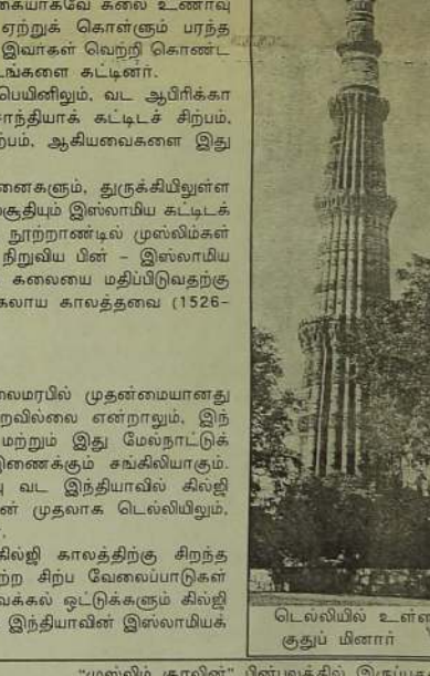
டெல்லியில் உள்ள குதுப் மினார்

"முஸ்லிம் குரலின்" பின்புத்தில் இருப்பதை பதிகங்களும் புடம் போட்டு காட்டுகின்றன. இதனால் நீண்ட காலம் நிலைத்து நிற்கும் என்பதே எமது எதிர்மார்பாகும். இவ்வகையில் வெளிவரக் கூடிய முஸ்லிம் பத்திரிகை சஞ்சிகைகளுக்கிடையில் ஓர் உறவுப் பாலம் அமைவதும், பத்திரிகைகளினதும் அதில் தம் பதிக்கும் எழுத்தாளர்களினதும் உதவை சந்தந்தும், பாதுகாப்பு குறித்து உதரவாதத்துடன் இயங்குவதும் முஸ்லிம் ஊடகத்துறையின் முன்னேற்றத்திற்காக விழுதங்கள் அமைக்கவும் ஒன்றிணைந்து செயற்படக் கூடிய கூட்டமைப்பொன்றை ஏற்படுத்துவது குறித்து "முஸ்லிம் குரல்" அதன் எதிர்கால இலக்குகளில் ஒன்றாக கொள்ள வேண்டும். முஸ்லிம் வாசகர்களின் முகங்கள் திசை திரும்பாமல் பார்த்துக் கொள்ளவும் நிலையான வாசகர்களான அதன் பக்கம் தக்க வைத்துக் கொள்ளவும் அவ்வப்போது புதிய மாற்றங்களை "முஸ்லிம் குரல்" கைகொள்ளும் என்ற நம்பிக்கை எமக்கு உண்டு.