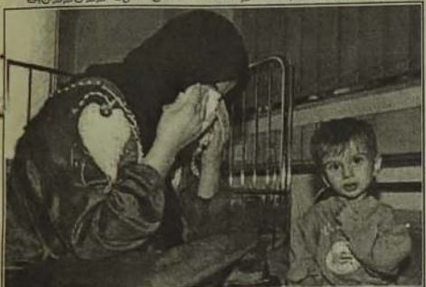
லெபனான், சியூபா, சூடான், வட கொரியாவாக அமெரிக்காவின் யுத்தத்தெரிவு இருக்கலாம்...?