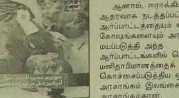
நாளாந்தம் எதிர்ப்புகள் வலுவடைந்து வருகின்றன.

கீ.ஐ.ஏ. இதுவரை இவ்வாறான சுமார் 2000 அரசியல் கலவரங்களையும், அமைதியின்மையையும் தோற்றுவித்துள்ளதாக கீ.ஐ.ஏ.யின் கேவலமான கடந்தகால வரலாற்று கூறுகின்றது.