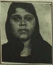
செய்யப்பட்டுள்ளார். புத்தகம் குறித்து சிபிடிபவியில் இச்சம்பவம் இடம் பெற்றுள்ளது.