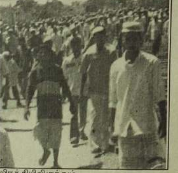
விரக்தியிலிருந்தும், செயலின்மையிலிருந்தும் விடுவித்து அவர்களுக்கு துணைசகல அளித்து அவர்களது சுய மரியாதையை பாதுகாக்க வேண்டிய பொறுப்பு நம்மிடம்தான் இருக்கின்றது.

கொள்ளாதே, உனது முயற்சியும் உனது எழுச்சியும் தான் மற்றவர்களின் எதிர்்பாப்பாக இருக்க வேண்டும். நமது மக்களை தாழ்வு மனப்பான்மையிலிருந்தும்.