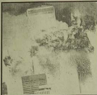
அவர்களது உரையில் இனிமேல்தான் அமெரிக்கா உண்மையான யுத்தத்தை எதிர்நோக்கப் போகின்றது என உறுதியுடன் தெரிவித்துள்ளனர் - இந்தச் செய்தியை அமெரிக்காவால் அதன் கூட்டாளிகளும் செப்டம்பர் 2001 தாக்குதலை விட அதிக பாதிப்புடன் எதிர் கொள்ள நேரிட்டிருக்கும் என்பதில் எவ்வித ஐயமுமில்லை.

மேலும் அத்தொலைக்காட்சி உலகமாவினதும் அவரது தளபதியான அய்மன் அல் ஜவாரியின் பங்குமேலும் ஒளிபரப்புச் செய்தன. மிகவும் வயது முதிர்ந்த தோற்றத்துடன் காணப்பட்ட உலகமாவினது உரையிலும் கம்பீரமும் கர்ச்சனையும் இருந்தது.