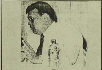
கலந்து கொள்ள புலிகள் மறுத்துள்ளமை பற்றி அரசாங்கம் யாது கருதுகிறது?

கேள்வி : ஜப்பானியத் தூதுவருடன் உதவி தொடர்பான கூட்டத்தில்