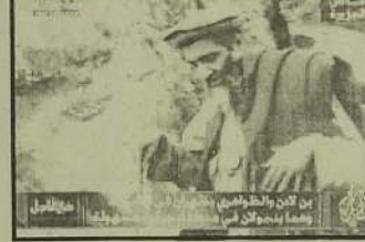
குனிவை அமெரிக்கா இந்த செப்டம்பர் 11இல் சந்தித்தது.

இவர்களது அல் ஜெஸீரா உரையை அடுத்து இப்போது உலகெங்கும் உள்ள மக்களில் அதிகமானோர் அமெரிக்காவின் முகமுடி சிபிந்தவிட்டதையும் உணர்ச்சிற்றனர். உலகமாவையும் அவரது இயக்கத்தையும் அழித்தொழிப்பதற்கே ஆப்கானிஸ்தான் மீது படையெடுத்து ஆயிரக்கணக்கானோரை கொன்று குவித்தோம் என்கிற அமெரிக்காவின் கொலைகளுக்கான நியாயம், இப்போது பொய்த்துப் போய்விட்டது. தலைகுனிவுக்கு மேல் தலை