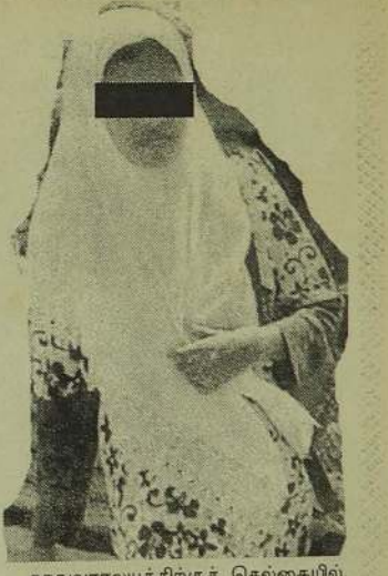
துதுவராலயத்திற்குச் செல்கையில், இரு வெளிநாட்டினரால் பலவந்தமாகக் கற்பழிக்கப்பட்டார்.

அபுதாபிக்கு பணிப்பெண்ணாகச் சென்ற ஒரு ஏழைப் பெண்ணுக்கு நடந்த கதையை இப்போது அப்பெண் கண்ணீர் மல்க ஊடகங்களுக்குத் தெரிவித்துள்ளார். பாதிக்கப்பட்ட அப்பெண்ணுக்கு நீதி கிடைப்பதற்கு எடுக்கப்பட்ட முயற்சிகள் அனைத்தும் தடுத்து நிறுத்தப்பட்டு வருகின்றன.