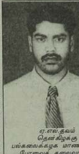
ஏ.எல்.தவம் தென் கிழக்கு பங்கலைக்குழுக் மாணவர் பிரேமைத் தலைவர்.

தமிழ் இளைஞர்கள் ஊனநாயக அரசியல் வழிமுறைகளின் மூலம் ஏமாற்றப்பட்டதன் விளைவாகவே ஆயுதப் போராட்டத்திற்கு திசைதிருப்பப்பட்டார்கள். ஆனால் முஸ்லிம் இளைஞர்கள் நிலைமைகளை உணரும் நிலைக்கு வந்திருக்கிறார்களே தவிர, இன்னும் போராட்ட நடைமுறைக்கு நகர்த்தப்படவில்லை. இந்நிலை நீடித்து முஸ்லிம் இளைஞர்கள் ஆயுதப் போராட்ட வழிமுறைக்கு திசை திருப்பாமல் இருக்க வேண்டுமாயின் அவை தமிழர்களின் நிலைப்பாட்டிலும், முஸ்லிம் அரசியல் தலைமைத்துவத்தின் வழிகாட்டிலும் தங்கி நிற்கின்றது. (கருத்துக்கள் தொடரும்)