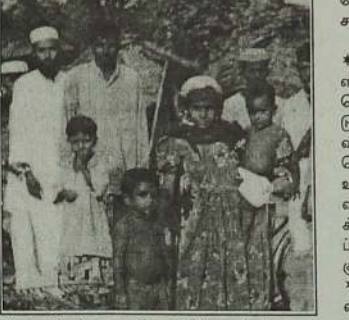
சிலர் 2000 ரூபா செலுத்தி வண்டிகளை பெற்று வந்திருப்பதாகவும், அவர்களின் அன்றாடப் பிழைப்புக்கு வேறு வழியில்லாத காரணத்தால் இவற்றை அனுசரித்துப் போவதாகவும் அறிய முடிகிறது. மேற்படி சம்பவங்கள் தொடர்பாக மூத்தர் பொலீஸில் முறைப்பாடுகள் செய்யப்பட்டிருக்கின்றன.

இதேவேளை மூத்தரின் இன்னொரு புலிகளின் கட்டுப்பாட்டுப் பிரதேசமான இராவ் குடியை அண்டிய பிரதேசத்தில் விருகக்காக சென்ற வண்டிகளும், மாடுகளும் புலிகளினால் தடுத்து வைக்கப்பட்டிருக்கின்றன. கடந்த செவ்வாயன்று இடம்பெற்றதாகக் கூறப்படும் இச்சம்பவத்தில் சம்பந்தப்பட்ட வண்டிக் கொள்ளைக்காரர்களில் 7000 ரூபாய்க்கும் கோரப்பட்டதாகத் தெரிவிக்கப்படுகிறது. அத்துடன் விருகக்காக வருபவர்கள் மாதா மாதம் 500 ரூபா செலுத்தும்படியும் கேட்கப்பட்டிருக்கிறார்கள் என்றும் தெரிவிக்கப்படுகிறது. வண்டில் உரிமையாளர்கள்