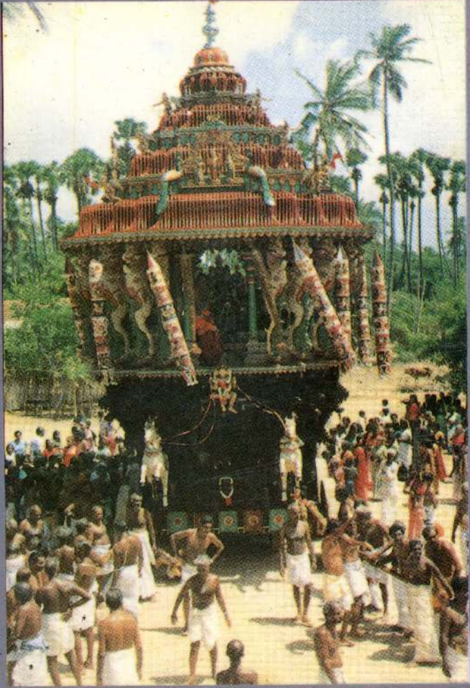
மஞ்சவனப்பதி முருகன் ஆலய சித்திரக்கீதர்.

Image N Print by Bougainville People's Park Colombo-11