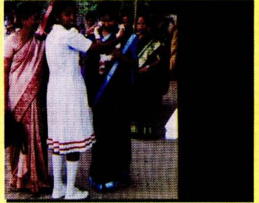
இல்ல விளையாட்டுப் போட்டி 1999