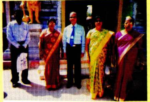
இல்ல மெய் வன்மைப்போட்டி விருந்தினருடன்--2015