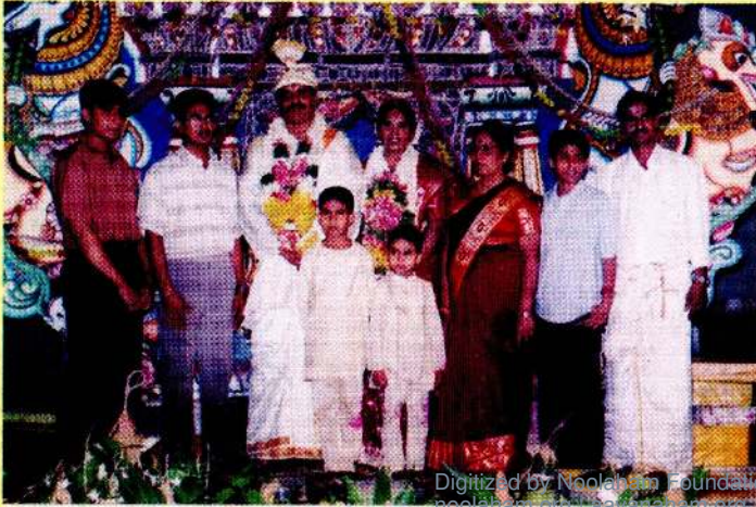
அன்புச்சுற்றியின் சிவபணக்கின் திருமண சிறப்பு விழா