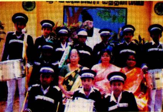
பான்ட் வாத்தியக் கழுவினருடன்