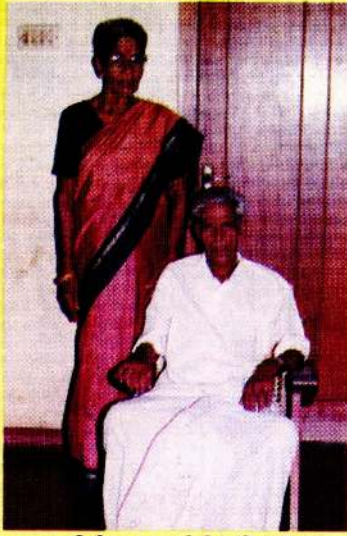
மணிவிழா நாயகியின் பெற்றோர் ஆசிரிய தம்பதிகள்