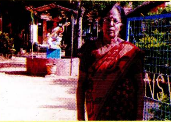
தினமும் காலை 7.00 மணிக்கு பாடசாலை மூன்றலில்