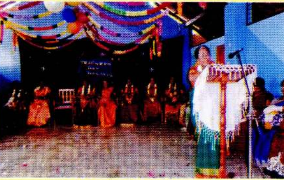
உப அதிபரின் வாழ்த்துரை