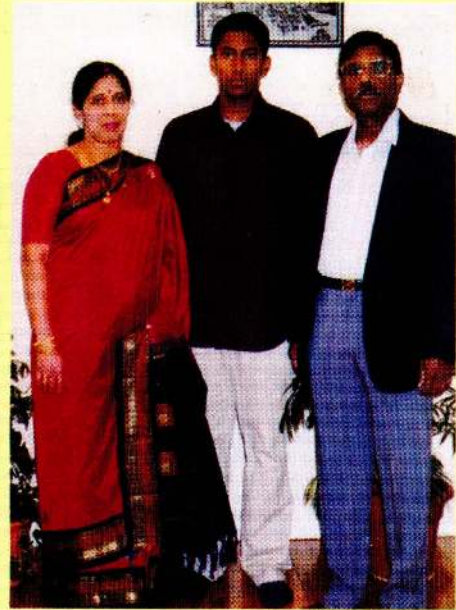
அன்புச் சகோதரியின் குடும்பம்