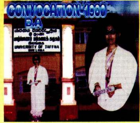
மணிவிழா நாயகியின் முதல்பட்டமளிப்பின்போது