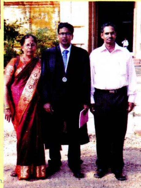
சிசோவ்ட மைற்கனின் பட்டமளிப்ப விழா