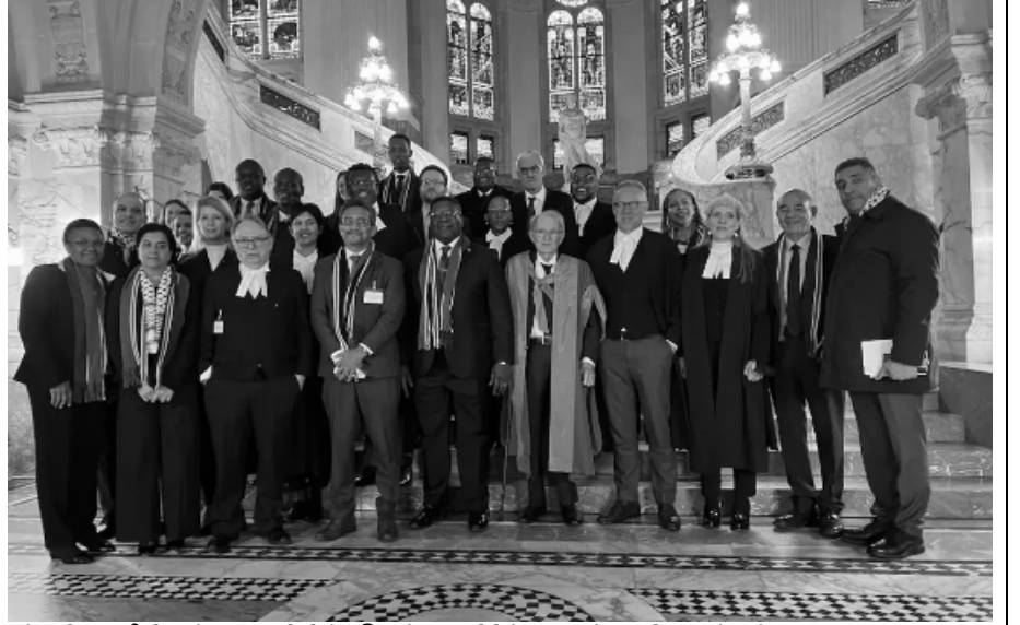
சர்வதேச நீதிமன்ற வாயிலில் தென் ஆப்பிரிக்கா சட்ட நிபுணர்கள் குழு

ஆகிய இரண்டு குற்றங்களும் நிரூபிக்கப்பட வேண்டும். இனப்படுகொலை செய்ததற்கான ஆதாரங்களை சமர்ப்பிக்க முடியும். ஆனால் இனப்படுகொலைக்கான நோக்கம் முன்கூட்டியே இருந்தது என்பது நிரூபிப்பது மிகவும் கடினமான செயல். இஸ்ரேல் விஷயத்தில் அந்தக் கடினம் தென் ஆப்பிரிக்காவுக்கு இருக்கவில்லை. அந்த பணியை