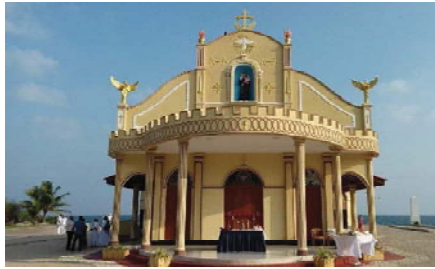
மேற்பட்ட பத்தர்கள் இத்திருவிழா திருப்பலியில் கலந்துகொள்வார் எனத் தெரிவிக்கப்பட்டுள்ளது.