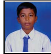
அ. ரித்தில் டயஸ் 175