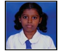
அ. பிரதிச்சனா 165