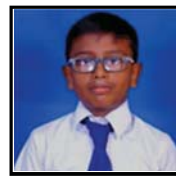
யூ. ரதில் மிராண்டா 163