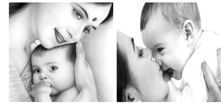
தாய் தன் ஒரே செல்லமகனை அன்போடு வளர்த்தார். மகன் வயதிலும், அறிவிலும் வளர வளர தன் தாயின் அரவணையில் இருந்து பிரிய ஆரம்பித்தான். காரணம் அவனுடைய தாயின் கையில் கண்ட வெள்ளை தழுபுக்கள். பரக்கவே அவனுக்கு அருவானாக இருந்தது. ஒருநாள் ‘தாய் அத்தகுறியுக்கள் ஏற்பட்டன’ என தாயிடம் கேட்டான். ‘எம் கண்ணீருடன் சொன்னான். ‘மகனே! நீ திருத்தையையிருந்தபோது நாம் இருந்த வீடு தீப்பற்றிக் கொண்டு, வெளியே சென்று திரும்பி வந்த நான் வீடு ஏரிவதைப் பார்த்து பதறினேன். நீ உள்ளே தாங்கிக் கொண்டிருந்தாய். எவ்வளவு கதறியும் யாரும் உதவவில்லை. நானே எரியும் வீட்டுக்குள் புகுந்து உன்னை தாங்கிக்கொண்டு வெளியில் வரும்போது நெருப்பு தாக்கி என் கை, காலெல்லாம் வெந்து விட்டன. அந்த நெருப்புடன் தழுபுத்தான் இது.’ மகன் இதையும் உடைந்து அந்த அழகிய கைகளில் முத்தமிட்டான்.

வங்கியின் பெயர் : Hatton National Bank Ltd, Mannar பணம் பெறுபவர் பெயர் : The Editor, 'MANNA' வங்கிக் கணக்கு இலக்கம் : S/A No. 02002029782