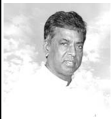
நோபேட் அடிகளார் யூன் 20