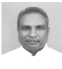
அவித்தப்பர் அடிகளார் யூன் 22