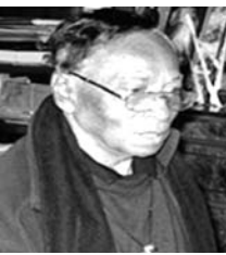
விக்ரம் குருஸ் அடிகளார் யூலை 04