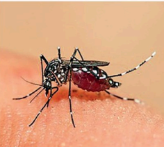
கனடா வைத்திய அதிகாரி பிரிவுகளில் தடா ஒரு நோயாளருமாக மொத்தம் 36 பேர் இடம் காணப்பட்டுள்ளனர். இருபுதினும், காந்தள்குடி, பட்டப்பளை, வவுனத்தீவு, வாக்கரை, ஆரையம்பதி

(மட்டக்களப்பு திருபுரம்) மட்டக்களப்பு மாவட்டத்தில் டெங்குநோய் பரவல் அதிகரித்து வருகின்றது. கடந்த ஏப்ரல் 09ஆம் திகதி தொடக்கம் ஏப்ரல் 15ஆம் திகதிவரையான காலப்பகுதியில் 36 பேர் டெங்குநோய் தாக்கத்திற்குள்ளாகியுள்ளனர். இத்தவாரம் டெங்கு தாக்கத்தினால் பாதிப்புக்குள்ளான மட்டக்களப்பு கனடா வைத்திய அதிகாரி பிரிவில் 10 நோயாளிகளும், ஊரலாஞ்சிக்ஊ கனடா வைத்திய அதிகாரி பிரிவில் 8 நோயாளிகளும், ஏறாஜூர் கனடா வைத்திய அதிகாரி பிரிவில் 6 நோயாளிகளும், டெங்குவடி கனடா வைத்திய அதிகாரி பிரிவில் 4 நோயாளிகளும், கோரையப்பற்று மத்திய கனடா வைத்திய அதிகாரி பிரிவில் 3 நோயாளிகளும், கிரான் கனடா வைத்திய அதிகாரி பிரிவில் 2 நோயாளிகளும், வாழைச்சேனை, ஓட்டமாவடி, வெள்ளையவெளி