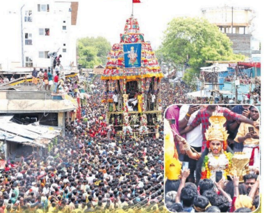
"ஓம் சக்தி..." என்று கோஷம் விண்ணை பிளக்க, பக்தர்கள் தெரிவிக்கப்பட்டிருக்கிறார்கள். அனைத்து நாடுகளிலும் மரியாதை செய்யப்பட்டுள்ளது.