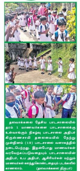
தலவாக்கலை தேசிய பாடசாலையில் தரம் 1 மாணவர்களை பாடசாலைக்கு உள்வரும் நிகழ்வு. பாடசாலை அதிகாரிகளின் சமீப தலைமையில் நேற்று முன்தினம் (19) பாடசாலை வளாகத்தில் நடைபெற்றது. இதன்போது மாணவர்கள் வரவேற்கப்பட்டுவரும் பாடசாலையில் தரம் 1, உட அதிபர், ஆசிரியர்கள் மற்றும் மாணவர்கள் கலந்துகொண்டனது பட்டகாரி சாலைவரம். (தலவாக்கலை திருபுர)