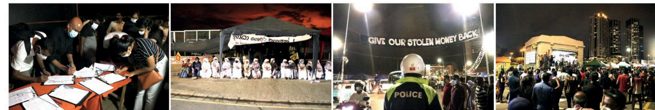
ஐதாபுதி உள்நிட அரளசம் உடனடியாக புதலி லிலக வேண்டுமென வலியுறுத்தி ஂசரும்பு, காலிமுகத்திலில் முள்ளெடுக்கப்பட்டெரும்பு தஂடர் ஆர்ப்பாட்டத்தின் 17ஆம் நாள்ளள நேற்று முள்ளிளளும் (25) பல்வெறு ஂர்ப்பு நடவடிக்கைகள் முள்ளெடுக்கப்பட்டன.