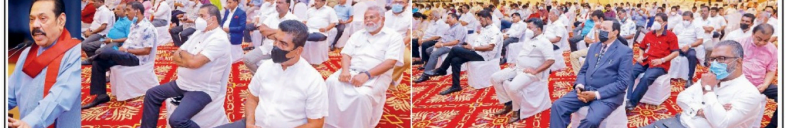
ஆளுத்தர்ப்பு நடராஜாவுக்கு உறுப்பினர்கள் மற்றும் மாணவ சபை உறுப்பினர்களின் ஒன்று அங்கத்தவர்கள் பிரதமர் மஹிந்த ராஜபக்ஷவை அலரி மாணிகையில் சந்தித்து நேற்று கலந்துரையாடல் நடத்தினர்.