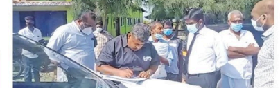
வாழ்வாயில் கட்டுப்பாட்டின் கணி அபகரிப்பு தேடிநிறுத்தம்!