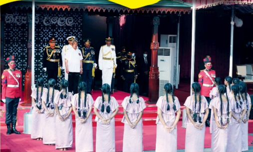
மிசர் பிரமாண்டமான முறையில் இந்த வருடம் நடத்தப்பட்ட தேசிய சுதந்திர தின நிகழ்வின் உள்நாட்டினங்கள் இராஜாங்க அமைச்சர் ஏற்பாடு செய்திருந்தது. இத்தகாக செலவழிக்கப்பட்ட நிதித் தொகை தொடர்பில் இராஜாங்க அமைச்சிற்கு கடந்த பெப்ரவரி 7-ஆம் திகதி தகவலறியும் விண்ணப்பமொன்று சமர்ப்பிக்கப்பட்டது. உள்நாட்டினங்கள் இராஜாங்க அமைச்சின் தகவல் அதிணரிபான நிரவாகப் பிரிவிரு