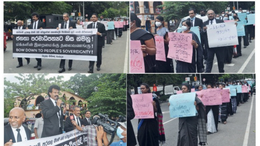
நாட்டில் மேற்கொள்ளப்பட்டுவரும், ஜனாதிபதி மற்றும் அரசுக்கெதிரான ஆர்ப்பாட்டங்களில் மக்களின் முன்வைக்கப்பட்டு கோரிக்கைக்கு வெளிச்சம் குறையாமல், மக்களின் ஆர்வமும் முன்வைப்பும் உடனடி தேர்தலைக் கோரியும் பழுவை மாவட்ட சட்டத்தரணிகள் சங்கத்தினால் பழுவையில் நேற்று (26) ஆர்ப்பாட்டமொன்று மேற்கொள்ளப்பட்டது. (எம்.செல்வராஜர், நடராஜர் மலர்வேத்தர்)

தம்புள்ளை கமந்தொழில் விவசாயத் திணைக்கள பிரதேசத்தில் வேலை பகுதியில் பெரிய வெங்காய உற்பத்தி அதிகமாக உள்ளதால் இவர்களும் எனக்காரும் எனக்காரும் விவசாயிகள், காரத்தாழ்த்தி வெங்காய உற்பத்தியை மேற்கொள்வதால் விவசாயிகளான ஏக்கர்களுக்கு ஏந்தலிதல் நன்மையும் ஏற்படப்போவதில்லை எனவும் உற்பத்தியாளர்கள் தெரிவிக்கின்றனர். தம்புள்ளை, சீகிரிய, கல்வேலை, நாவுல, வக்கை, பல்வேலை, கெக்கிராய, அனாராபுரம், கண்டிமங்கலம், கல்கியாபலம், பூட்டியாபலம், கண்டிமங்கலம், திண்டிவனம், பகலூர், திப்பேறு போன்ற பகுதிகளிலேயே அதிகமான பெரிய வெங்காய உற்பத்தி இடம்பெறுகின்றது.