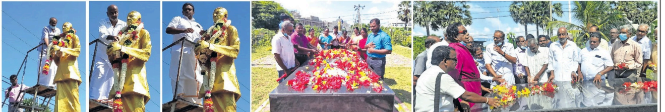
இவ்வகை தமிழர்க்கு கட்சியின் ஸ்தாபக தந்தை செல்வாவின் 45 ஆவது நினைவு தினம் நேற்று அனுஷ்டிக்கப்பட்டது. மாண்புமிகு அமைச்சர் சி.வி. விவேகானந்தன் தலைமையில் தந்தை செல்வாவின் நினைவு தினம் கொண்டாடப்பட்டது. இந்நேரத்தில் தந்தை செல்வாவின் உருவச் சிலைக்கு மலர்மாலை அணிவிக்கப்பட்டது.