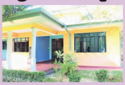
(நிறந்தல் திருபர்) அம்பாறை மாவட்ட செயலகத்தில் கடமைபாற்றும் உத்தியோகத்தின்கீழ் பிள்ளைகளுக்கு மட்டுமே அனைத்து அரசு நிறுவனங்களிலும் பணிபுரியும்

உத்தியோகத்தின்கீழ் பணியாற்றும் அம்பாறை மாவட்ட செயலக பகல்நேர பிள்ளைகள் பராமரிப்பு நிலையம் அம்பாறையில் அண்மையில் திறந்துவைக்கப்பட்டுள்ளது. பகல்நேர பராமரிப்பு நிலையம் பிரதிபலிக்க