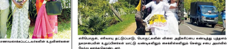
எரிபொருள், எரியாது தட்டுப்பாடு, பொருளின் விலை அதிகரிப்பை எதிர்த்து முதலாம் நேற்று கலந்துரையாடல் நடந்தனர் மட்டு வலங்கலியும் கைக்கிள்கலியும் சென்று சபை அரங்கில் நேற்று கலந்துகொண்டனர்.

இந்த பாதுகாப்புத்துறைக்கு சுமார் ஒரு மணித்தியாலம் முன்னதாகவே ஆயிரக்கணக்கான மக்கள் கண்டிக்கு வருகைகளைத் தொடர்ந்து கொண்டுவந்தனர். கண்டி, மாவட்டத்திலுள்ள அனைத்து தொகுதிகளையும் உள்ளடக்கியவாறு வருகைகளை மக்களால் கண்டி நகரம் நிறிபி வழிந்தது. கண்டி நகரத்திற்குள்ளிருந்து ஆரம்பமான போரணி பொதுக 2 மணியளவில் போரணையை வந்தடைந்தது.