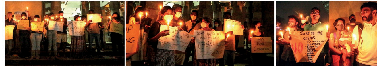
மகக் மீது தெடாய்ப்பு அருத்தம் பிரயோசிப்பதை விடுத்து அரளசம் உடனடியாக புதலி லிலக வேண்டுமென வலியுறுத்தி நேற்று முள்ளிளளும் (25) இரவு செருமபு, கந்திரி தூக்கத்தில் ஆர்ப்பாட்டமொன்று முள்ளெடுக்கப்பட்டது.

ஆறு பேர் காயம் சென்று மரெருள்ளும் மோதியதும், விபத்துக்குள்ளாகியபர் பஸ் செருமபிடுகருந்து மள்ளர் வறற யானித்துள்ளது. வெயிரானெளி விடுத்து வலு இவகைசுபில் விபத்துவரும் சிவ் காரில் இருந்துள்ளார். இந் விபத்தில் காரிலிருந்த வலுக்குள் காயம் ஏற்பட, சிவ்வை ஂள்ளதுடன், பஸ்ஸில் பயனித்த சிவ் இவ்வாறு காயங்களுக்குள்ளாகியுள்ளதாக பொலிஸார் குறிப்பிட்டனர். சாரதிமணம் மலலிள் வேத்தைக் கட்டுப்பாட்டுக்கு தெடாய்ப்பு நமபாளமைபினும், இந் விபத்து இடம்பெற்றிருக்காமல் ஂந பெலிஸார் மேலும் குறிப்பிட்டனர். இந் விபத்து தெடாய்ப்பான மேலிகல் விளராண கணை புத்தளம் டெராலில் போல்குளரத்து பரிசிட முள்ளெடுத்து வருகின்றது.