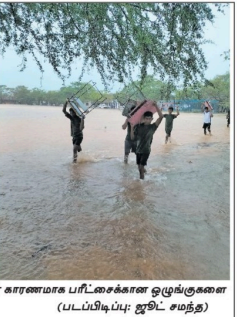
புத்தளம் மாவட்டத்தில் நேற்றுமுன்தினம் பெய்த அடையாள காரணமாக சில படகுகளில் க.பொ.த. துறைநா தர மணவர்கள் பரிட்சையில் நேற்றுவுதில் சிரமத்தை எதிர்நோக்கினர். இதன் காரணமாக பரிட்சைகளை ஒழுங்குபடுத்தும் மையமியும் இராணுவத்தினர் மேற்கொண்ட நடவடிக்கை காரணம்.