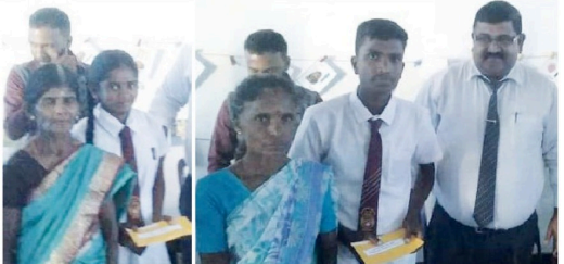
ஊக்கிய அலமினாக்களில் இயங்கும் நண்பர்கள் வட்டத்தின் முத்தமிழ் முன்னேற்றக் கழகம் அமைப்பினூடாக எதிவரும் 02 ஆண்டுகளுக்கு மிகவும் தொலைவில் பயணிக்கும் 15 மாணவர்களுக்கு போக்குவரத்து செலவை புலமைப்பரிசிலாக பெற்றுக்கொடுக்கும் நிகழ்வு நேற்றுமுன்தினம் (28) நிகழ்ந்தது. இதன்போது பயணியர் மாணவர்களுக்கும் கவனம் செலவுகளை வழங்குவதற்கான பணிகளை மேற்கொண்டனர். (செ.தி.பெருமார்)