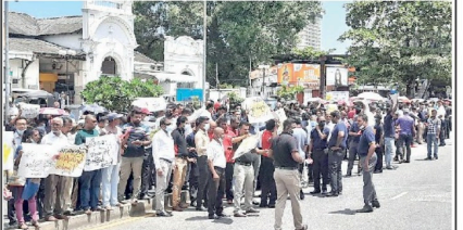
அரசு வங்கிகள், ஆசிரியர்கள், மின்சார சேவை, விவசாய நிறுவனங்களின் தொழிற் சங்கங்கள் இணைந்து மாடுபெரும் ஆர்ப்பாட்டமொன்றை நேற்று கோட்டை ரயில் நிலைய முன்றலில் நடத்தினர்.