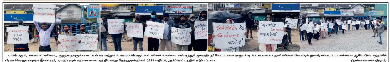
எரிபொருள், சமையல் சரிவாயு, குழந்தைகளுக்கான பால் மா மற்றும் உணவுப் பொருட்கள் விலை உயர்வால் கவந்துள்ள ஜனாதிபதி கோட்டரய ராஜபக்ஷ உடனடியாக பதவி விலக்க கோரியும் சுவரெலியா, உட்புலமை ஆலோசனை சந்திப்பில் கிராம பொதுமக்களும் இணைந்து, புலவிகளும் பதகைகளை எந்தியவாறு நேற்றுமுன்தினம் (28) எதிப்பாட்டில் ஈடுபட்டனர்.

(ஏ.ஏ.எம்.பாமில்) பலாங்கிடைமையில் தேர்தல் நேரத்திற்குட்பட்ட பல விவசாய பிரதேசங்களில் குரங்குகள் தொல்லை கொடுத்து வருவதாக பிரதேசவாசிகள் புகார் தெரிவிக்கின்றனர். இப்புகார், அலுவலர், பெலிஹெய், பம்பிஹெய், தென்னியின்ன, வேலிஹெய், உணவுக்காக இவை வருகை தருவதால் பயிர்களை நாசம் செய்வது மட்டுமன்றி இவற்றின் செயற்பாடுகள் மக்களின் அன்றாட வாழ்க்கை நடவடிக்கைகளையும் பாதிப்பதையும் செய்வது. இவை வீடுகளை ஆக்கிரமித்து உணவுப் பொருட்களையும் வீட்டு உபயோகங்களிலும் தேக்கத்தை விளைவிப்பதாகவும் பிரதேச மக்கள் தெரிவிக்கின்றனர். உணவுக்காக இவை வருகை தருவதால்