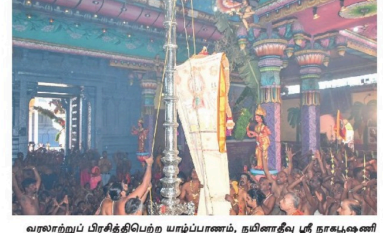
வரலாற்றுப் பிரசித்திபெற்ற யாழ்ப்பாணம், நமினாதிபு ஸ்ரீ நாகபூஷணி அம்மன் ஆலய வருடாந்த மகேஸ்வலப் பெருவிழா நேற்று புதன் கிழமை நண்பகல் 12 மணிக்கு கொடியேற்றத்துடன் ஆரம்பமாகியது.