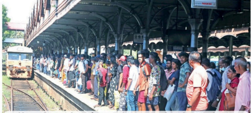
எரிபொருள் நெருக்கடி, பொதுப் போக்குவரத்திலும் தாக்கத்தை செலுத்தியுள்ளதால் பெரும்பாலான மக்கள் ரயில் சேவையை நம்பியுள்ளனர். அதனால் ரயில் நிலையங்களில் மக்கள் கூட்டம் அதிகளவில் இருக்கிறது. கோட்டை ரயில் நிலையத்தின் காட்சி இது.