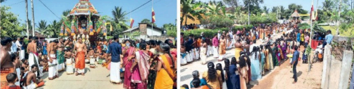
(முதற் திருவர்) திருகோணமலை மீனாட்சி அம்மையின் வருடாந்த தோர்த்திவிழா.