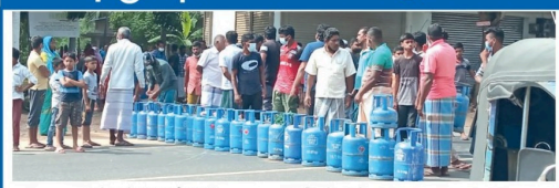
(சம்மாந்துறை திருவர்) சமையல் எரிவாயுவை பெற்றுத்தருமாறு கோரி சம்மாந்துறை மக்கள் ஆர்ப்பாட்டம்.

சமையல் எரிவாயுவை பெற்றுத்தருமாறு கோரி சம்மாந்துறை மக்கள் ஆர்ப்பாட்டம். சமையல் எரிவாயுவை பெற்றுத்தருமாறு கோரி சம்மாந்துறை மக்கள் ஆர்ப்பாட்டம். சமையல் எரிவாயுவை பெற்றுத்தருமாறு கோரி சம்மாந்துறை மக்கள் ஆர்ப்பாட்டம்.