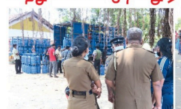
(பட்டக்கள - வி.கி.சி.குமார்) அக்கரைப்பற்றில் அமைந்துள்ள எரிவாயு விபரண நிலையத்திற்கு அருகில் நேற்று முன்தினம் (26) மக்கள் சமையல் எரிவாயுவை பெற்றுக்கொள்ள வரிசையில் காத்திருந்தபோது...