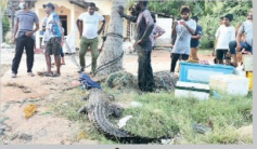
(ரவடீய பாலியல்) மீன்பிடி வலையில் சிக்கிய 8 அடி நீளமுள்ள முதலை.

திருகோணமலை, சைக்கிளா, மொட்டே பிரதேசத்தில் மீன்பிடி வலையில் வலையில் மீன்பிடிக்க வந்த ஒரு சிக்கியதாக உள்ளது. சைக்கிளா, மொட்டே பிரதேசத்தில் மீன்பிடி வலையில் மீன்பிடிக்க வந்த ஒரு சிக்கியதாக உள்ளது.