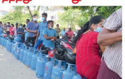
(பட்டக்கள - வி.கி.சி.குமார்) அக்கரைப்பற்றில் அமைந்துள்ள எரிவாயு விபரண நிலையத்திற்கு அருகில் நேற்று முன்தினம் (26) மக்கள் சமையல் எரிவாயுவை பெற்றுக்கொள்ள வரிசையில் காத்திருந்தபோது...